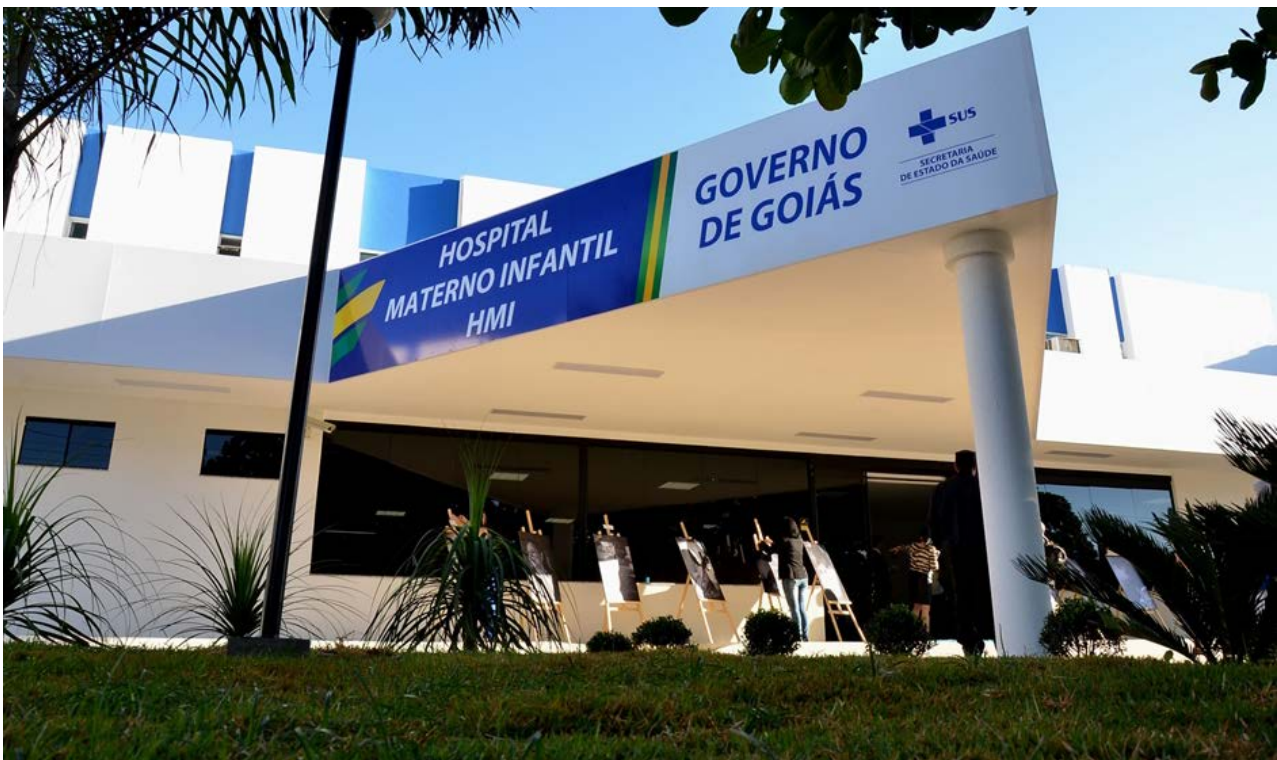
Governo de Goiás

de inscrição devidamente preenchidos e documentos em mãos, de acordo com o edital. Outras informações poderão ser obtidas no telefone (62) 3956.2972.