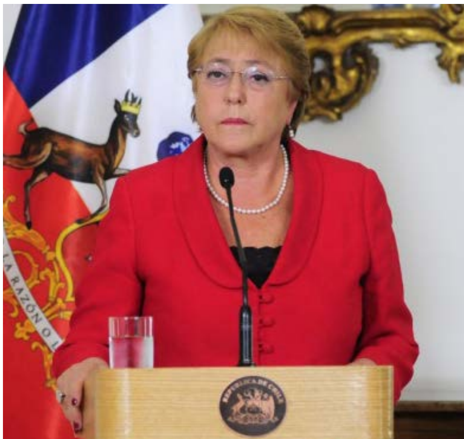
Gobierno de Chile

"As decisões judiciais devem ser acatadas, é o que corresponde em um Estado de direito", escreveu no Twitter a ex-presidente Michelle Bachelet, que acrescentou, no entanto, que o tribunal, "com seu pronunciamento sobre o lucro, que contradiz a análise de constitucionalidade de todos os setores no Congresso, distorce a decisão democrática de eliminar o lucro na educação superior".