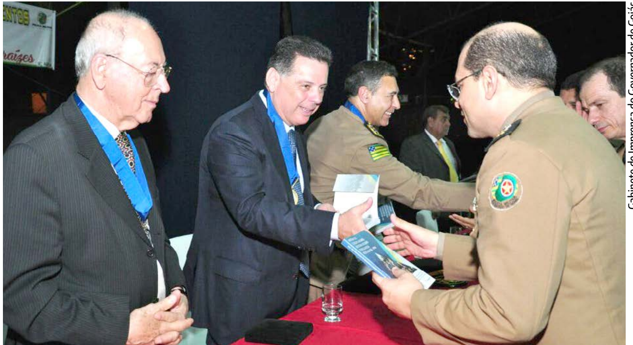
Cabinete de Imprensa do Governador de Goiás

Ao discursar na solenidade, o governador Marconi disse que a FPM é um projeto bem-sucedido que surgiu como desdobramento natural do êxito dos Colégios Militares em Goiás. "Goiás dá mais uma vez exemplo de boas iniciativas e eficiência,