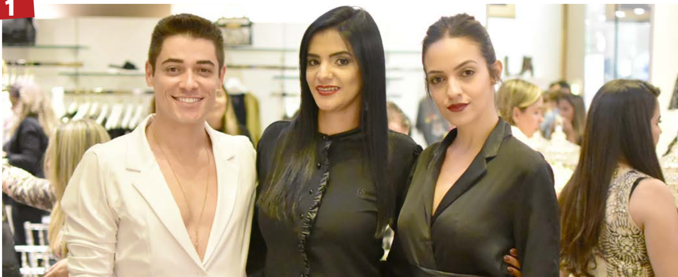
Wallisson – PhotoFrame