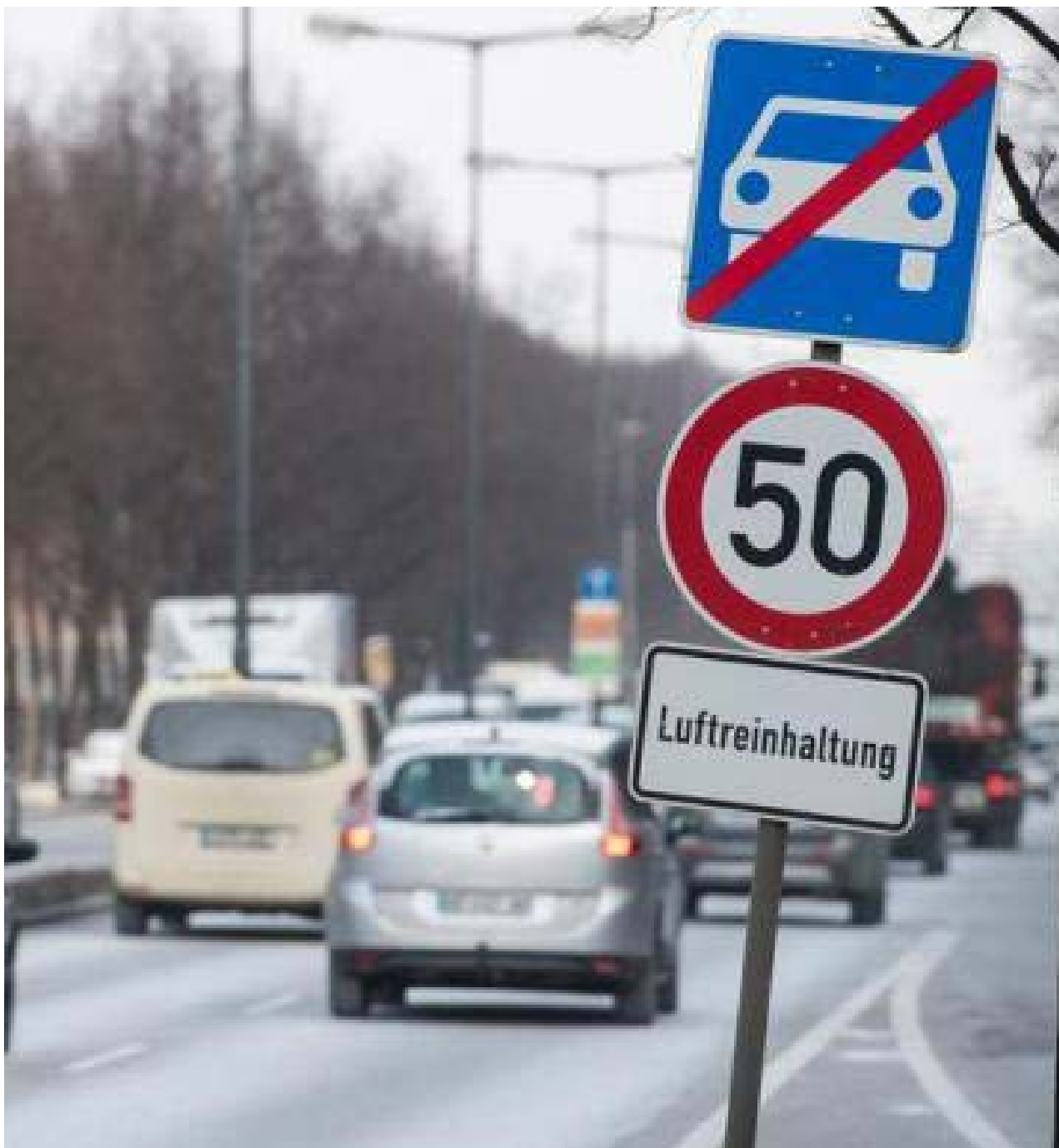
Sinalização de tráfego indica "controle de poluição do ar" e o limite de velocidade de 50 km/h em Munique, na Alemanha

O Superior Tribunal sentenciou hoje que a medida é legal e que não se necessita de uma regulação federal para que as cidades possam aplicá-la.