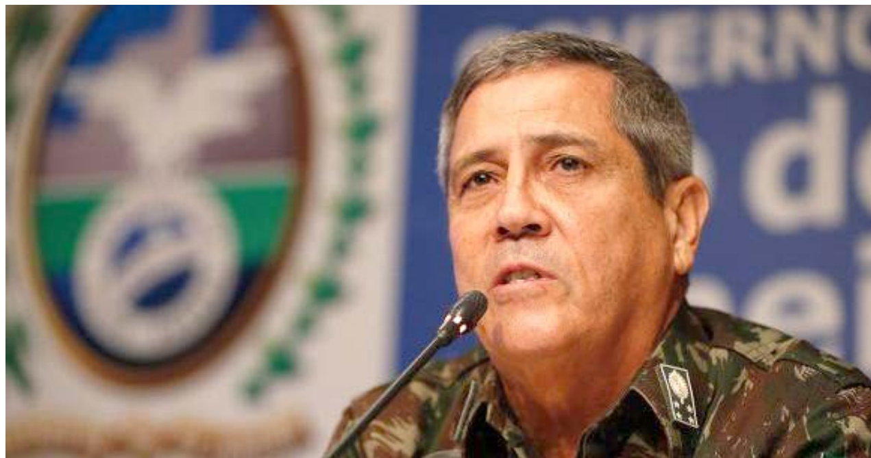
General Braga Netto afirmou que as operações nas comunidades são pontuais e por tempo determinado

no tempo é atuar nesses gargalos que hoje trazem alguma dificuldade aos órgãos de segurança pública”, avaliou Sinott, que apontou problemas como atrasos de pagamentos de agentes, viaturas deficientes e necessidade de recomposição de efetivo.