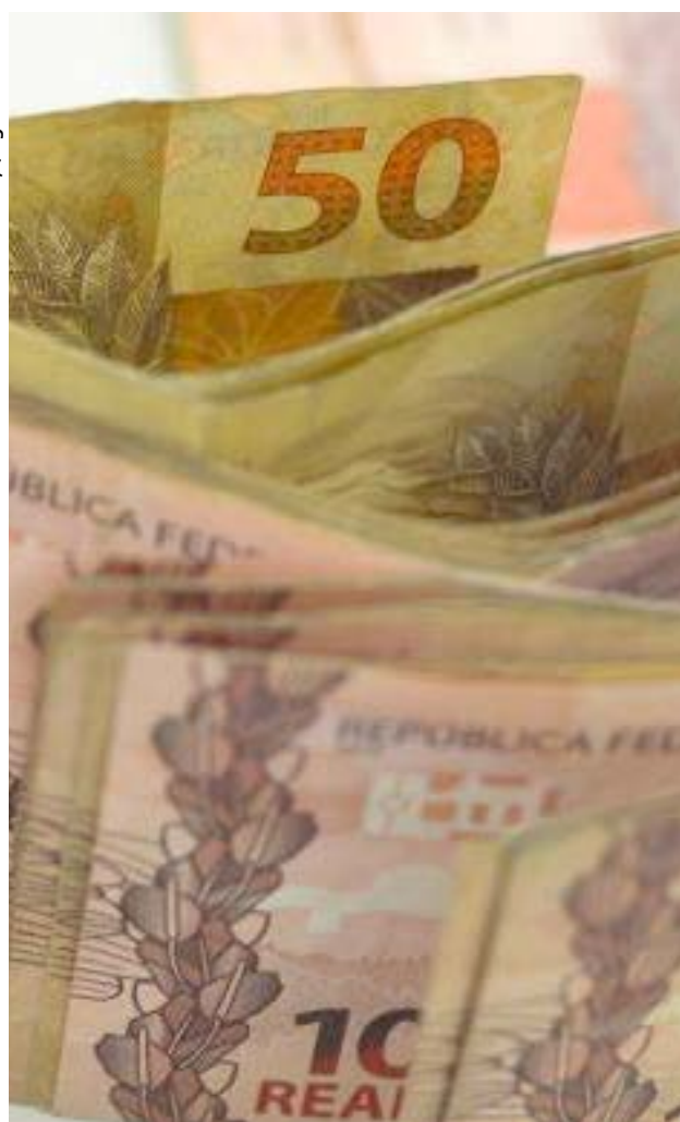
Dívida Pública Federal caiu 0,87%, passando de R$ 3,559 trilhões, em dezembro, para R$ 3,528 trilhões, em janeiro

Em seguida, estão as instituições financeiras com 21,29%, grupo que também reduziu o estoque, indo de R$ 766,96 bilhões para R$ 725,05 bilhões. Os investidores estrangeiros concentraram 12,41% da dívida; o governo, 4,47%; as seguradoras, 3,90%; e outros, 5,66%.