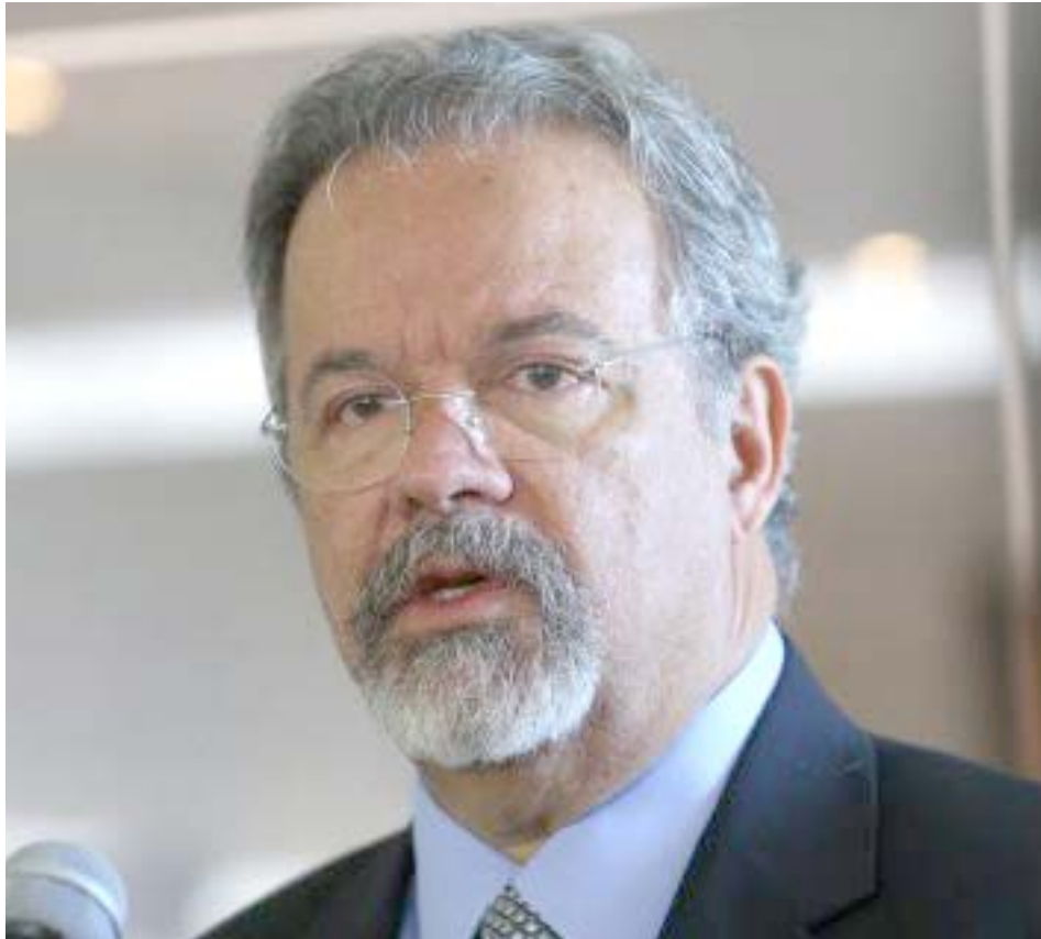
Raul Jungmann assumirá o comando do novo Ministério Extraordinário da Segurança Pública

do Ministério da Defesa desde maio de 2016, quando tomou posse prometendo dar prosseguimento aos projetos estratégicos das Forças Armadas (Exér-