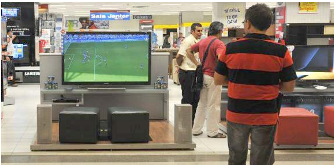
De acordo com a CNC, o crescimento chegou a 13% na comparação com fevereiro de 2017

Na comparação com janeiro, as melhores avaliações foram observadas nos componentes de momento para a compra de bens duráveis (5,8%) e perspectiva profissional (5,3%). Já na comparação com fevereiro de 2017, os destaques foram a perspectiva de consumo (25,7%) e momento para duráveis (23,5%).