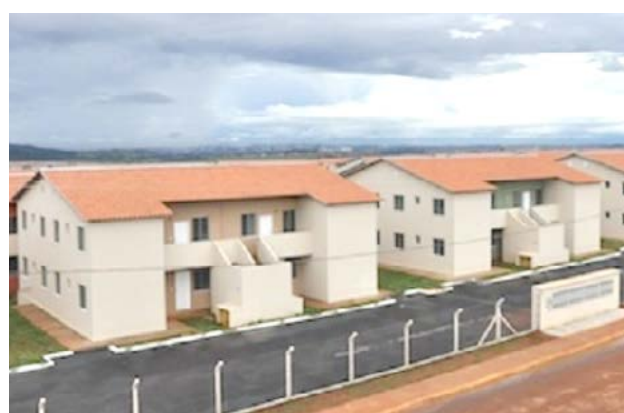
Prefeitura de Goiânia

referida taxa, apresentada em boleto do Banco Itaú. Ressalta que todos os trâmites das seleções realizadas pelo Programa Municipal de Habitação de Interesse Social da Prefeitura de Goiânia, inclusive os financeiros, são realizados com ampla divulgação por parte da secretaria no próprio site da Prefeitura de Goiânia e na imprensa local.