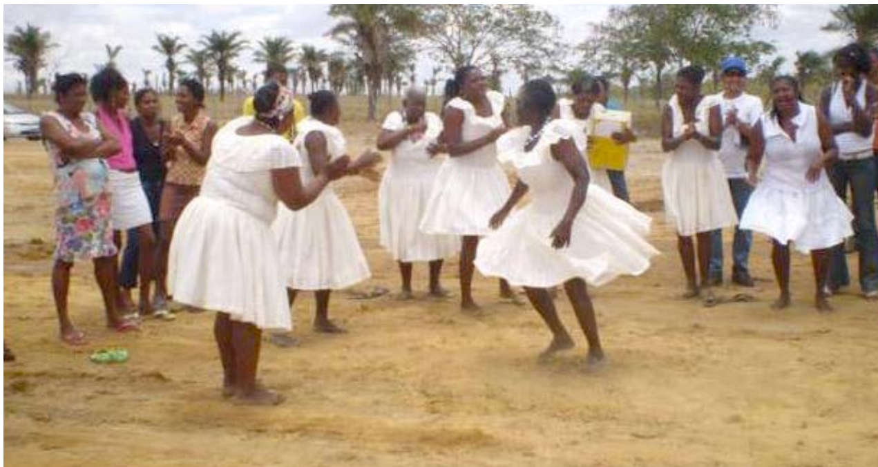
Ministério do Desenvolvimento Agrário

O julgamento foi suspenso no final do ano passado e retomado nesta tarde, com o voto do ministro Edson Fachin,