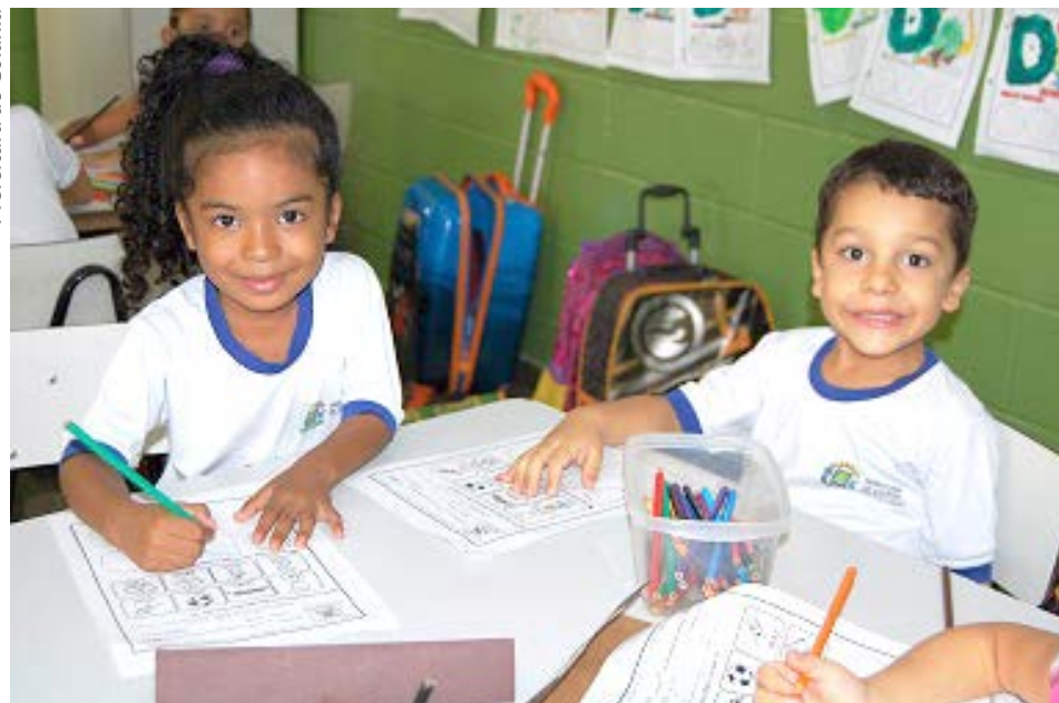
Prefeitura de Goiânia

Escolas da rede municipal ou estadual de todo o Brasil têm até o dia 16 de fevereiro para aderir ao Programa Mais Alfabetização, do Ministério da Educação (MEC). A Secretaria Municipal de Educação e Esporte (SME) de Goiânia fez adesão ao novo programa e as 163 instituições que atendem turmas de primeiro e segundo ano do ensino fundamental precisam se cadastrar.