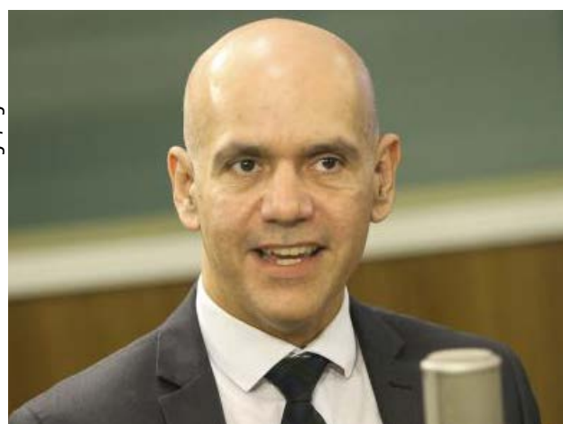
O secretário de Previdência Social do Ministério da Fazenda, Marcelo Caetano, disse que caso a reforma não seja aprovada, o governo teria de estudar o aumento de tributos ou o corte de gastos

O secretário de Previdência do Ministério da Fazenda, Marcelo Caetano, disse estar otimista de que a reforma da Previdência será aprovada. Segundo ele, os próximos dias “serão de muita conversa [com o Congresso] e de muita explicação a respeito da reforma para obtenção dos votos necessários para a aprovação”.