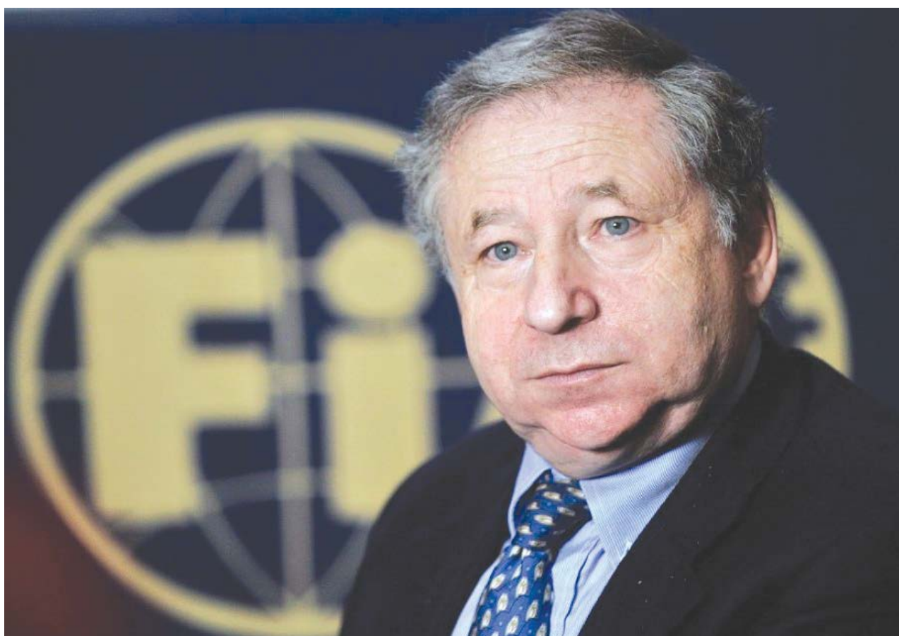
Jean Todt, presidente da Fia, se disse satisfeito em aproximar crianças de seus heróis