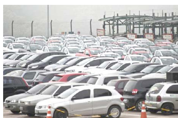
Vendas de veículos novos subiram 23,14% em janeiro na comparação com o mesmo mês de 2017

Para 2018, a perspectiva da entidade é que aconteça uma melhora gradual, com o setor retomando o ritmo de crescimento do período anterior antes da crise econômica.