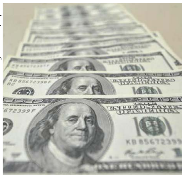
O PKB sofreu um confisco de um milhão e quatrocentos mil dólares

A agência reguladora dos mercados financeiros da Suíça (Finma) confiscou US$ 1,4 milhão do banco suíço PKB por sua participação no escândalo da Operação Lava Jato. A informação é da EFE.