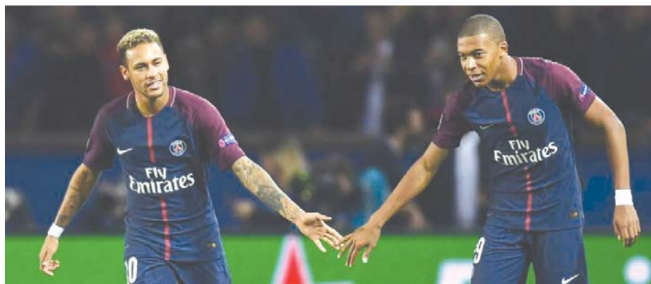
Neymar e Mbappé: pivôs da polêmica com o Rennes, em ação pelo PSG

“Neymar você é um grande jogador, mas quem saiu lesionado depois de uma falta? Um jogador do Rennes, Ismaila Sarr, que estará fora do plantel por três meses por causa de outro gesto feio”, argumentou o clube francês se referindo a uma entrada dura de Kylian Mbappé.