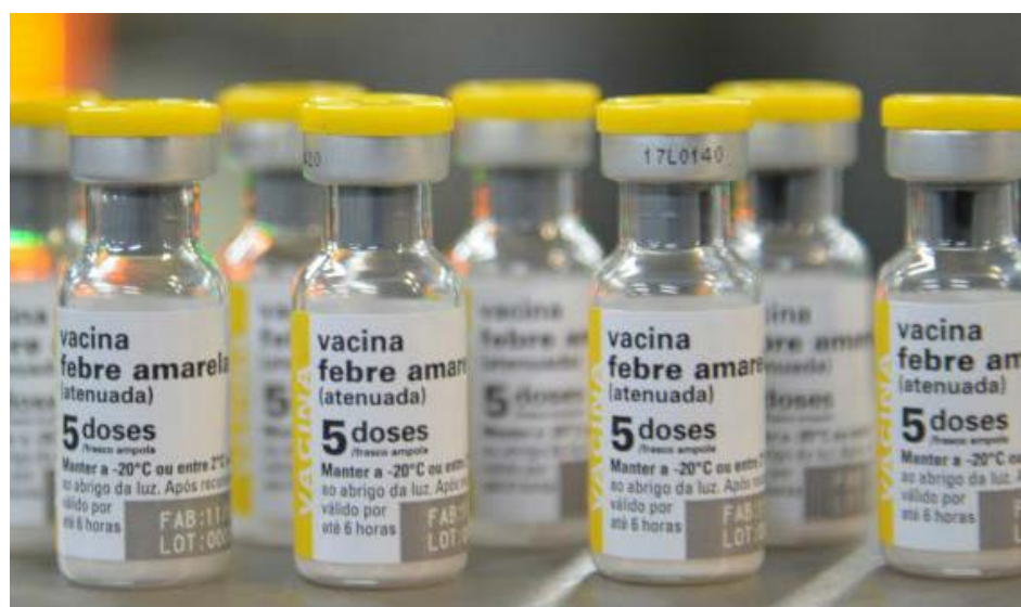
A circulação do vírus da febre amarela em áreas mais amplas do que vinha sendo observado nos anos anteriores, incluindo centros urbanos, fez com que o governo federal antecipasse a campanha de imunização no RJ e em SP

Para viabilizar ações de combate à doença, a pasta se comprometeu a encaminhar aos estados R$ 54 milhões. Do total, já foram repassados R$ 15,8 milhões para São Paulo e R$ 30 milhões para Rio de Janeiro, onde na segunda-feira (29), o número de mortes pela doença chegou a nove, conforme informou a Subsecretaria de Vigilância em Saúde da Secretaria de Estado de Saúde.