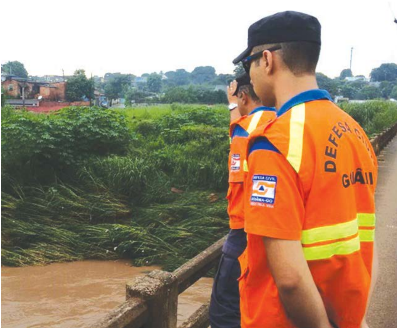
As equipes da Defesa Civil Municipal intensificaram o monitoramento em diversas áreas de risco da Capital.

A Defesa Civil reforça que em situações de perigo, a orientação é entrar em contato pelo 153 ou pelo 3524-4080, ou para o Corpo de Bombeiros Militar 193.