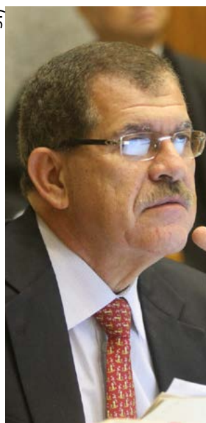
Ministro Humberto Martins

O vice-presidente do Superior Tribunal de Justiça (STJ), ministro Humberto Martins, negou na terça-feira (30) habeas corpus preventivo para evitar a prisão do ex-presidente Luiz Inácio Lula da Silva.