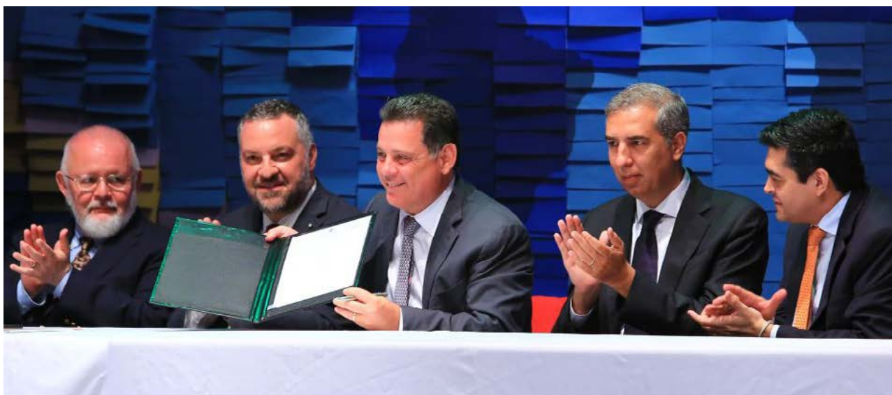
Assessoria do Governador