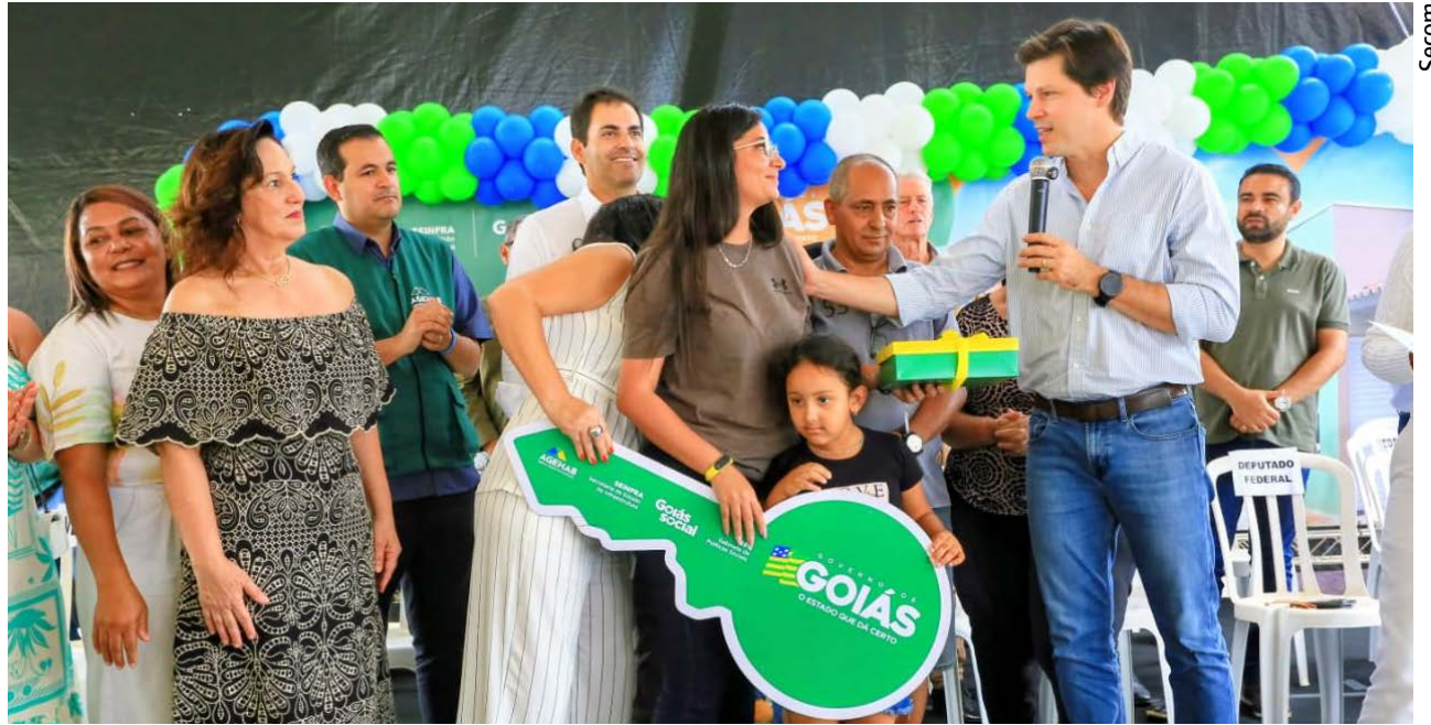
Governador Daniel Vilela durante entrega de casas do Programa Casas a Custo Zero, do Goiás Social: investimentos em habitação, em saúde, educação, segurança e assistência social contribuem para avanço de Goiás em qualidade de vida no IPS Brasil 2026

Entre os componentes analisados estão saúde, educação, saneamento, moradia, segurança, acesso à informação, meio ambiente, inclusão social, direitos individuais e acesso à educação superior. Em Goiás, algumas políticas públicas contribuíram diretamente para ampliar o acesso da população a serviços essenciais e oportunidades. É o caso, por exemplo, do Goiás Social, que reúne programas