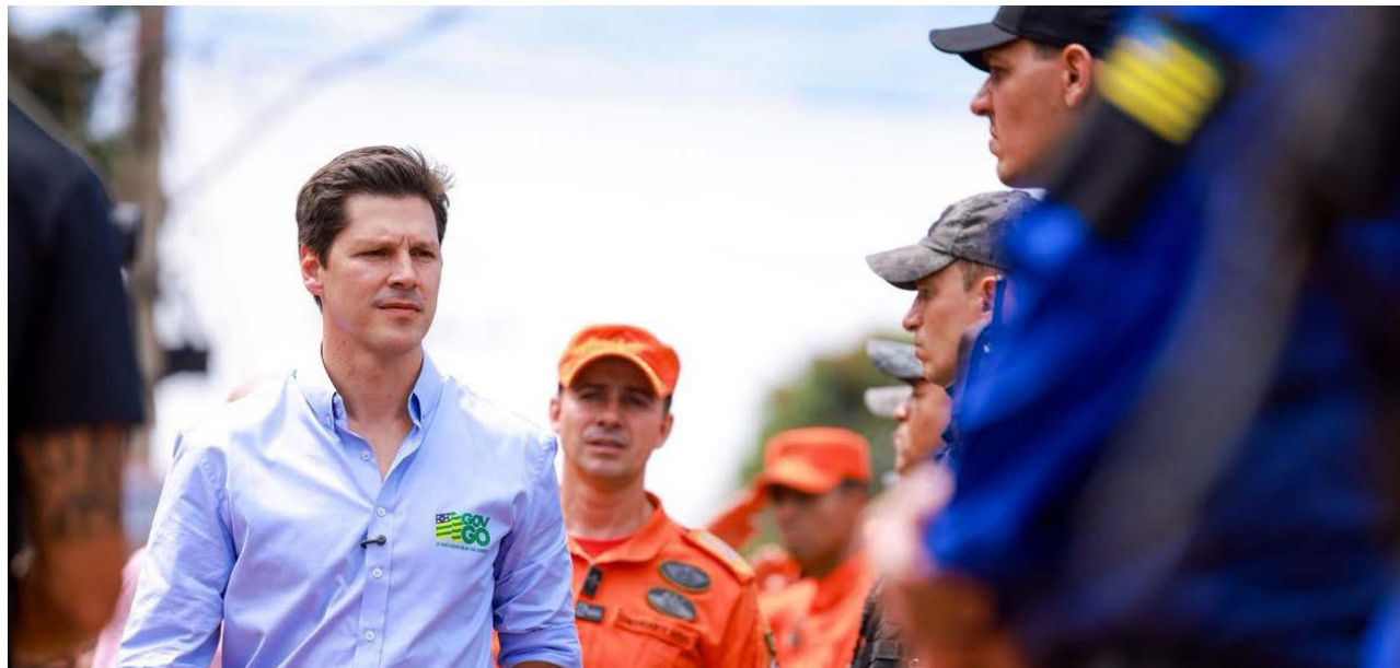
Governador Daniel Vilela anunciou pacote de valorização das forças de segurança pública com investimento de R$ 1,2 bilhão até 2027

Entre os principais pontos do pacote anunciado por Daniel Vilela está o pagamento de auxílio-ali-