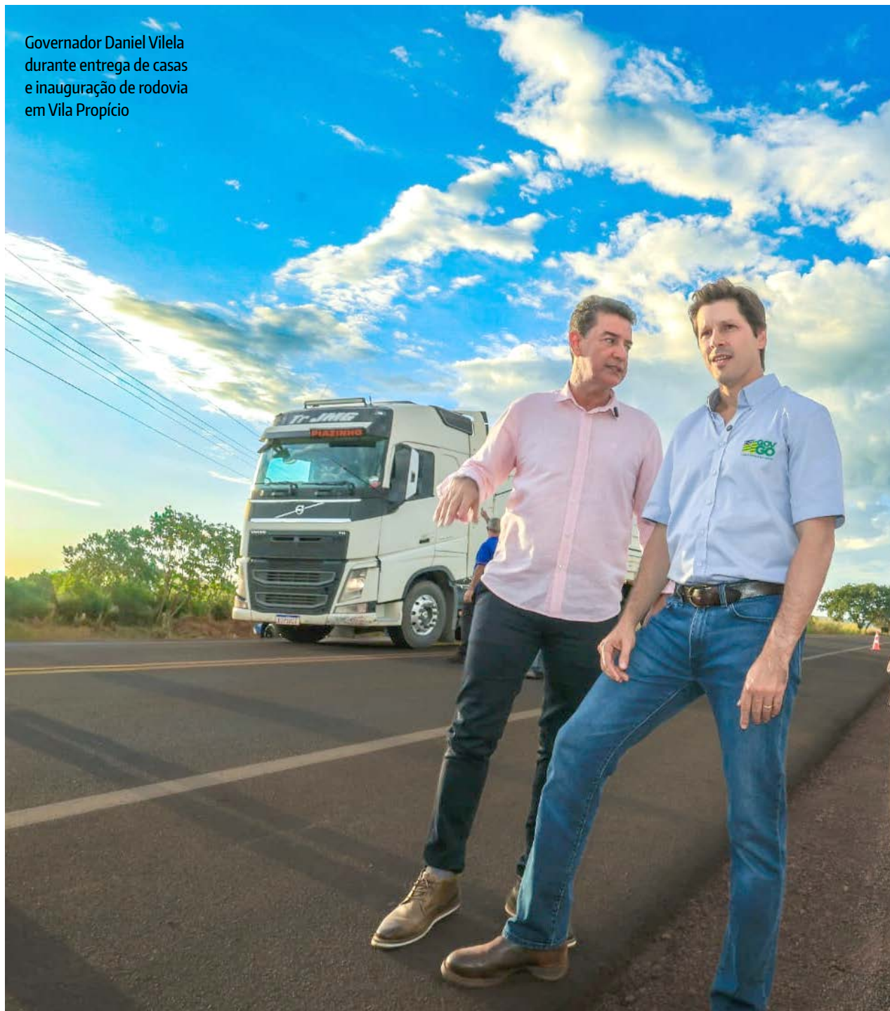
Governador Daniel Vilela durante entrega de casas e inauguração de rodovia em Vila Propício

O governador ressaltou a continuidade da regionalização dos investimentos para melhorias estruturais e mais qualidade de vida em todos os quadrantes do Estado. “Esse é o padrão de todas as nossas obras. Têm obras para todas as regiões. E nós vamos inaugurar muitas ao longo dos próximos meses”, pontuou. Ele também enalteceu a parceria com o agro. “Ações conjuntas permitiram esse volume tão significativo de obras rodoviárias que estamos inaugurando”, acrescentou