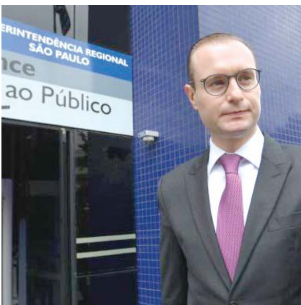
O advogado Cristiano Zanin entrega o passaporte do ex-presidente Luiz Inácio Lula da Silva na Superintendência Regional da PF em São Paulo