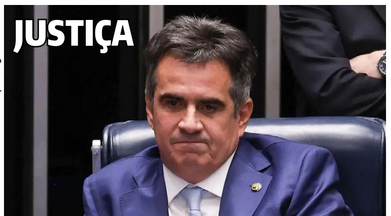
Senador Ciro Nogueira é alvo da 5ª fase da Operação Compliance Zero - BRASIL | 7