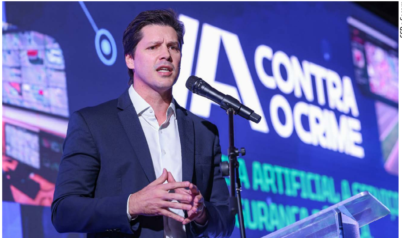
SSP e Secom

A plataforma IA Contra o Crime integra câmeras de videomonitoramento, análise de dados e inteligência artificial para apoiar o trabalho das forças de segurança. O sistema permite o cruzamento de informações a partir de dados parciais, contribuindo para a identificação de suspeitos e o direcionamento mais preciso das equipes em campo. Isso tem possibilitado respostas mais rápidas e maior eficiência na elucidação de ocorrências, com compartilhamento de alertas em tempo real entre diferentes unidades e municípios.