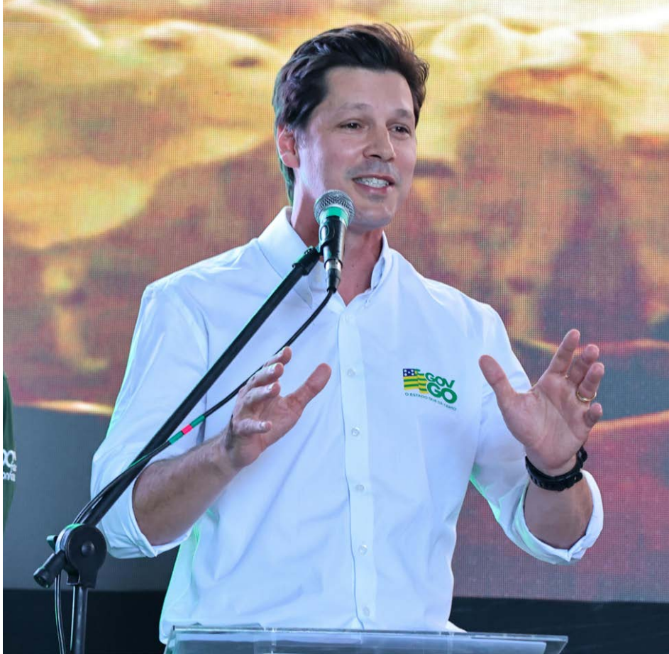
Daniel Vilela participa da 2ª edição da Conforto Experience, em Nova Crixás, no Norte goiano

O governador Daniel Vilela destacou, nesta quarta-feira (6/5), ações do Governo de Goiás para impulsionar o agronegócio, durante a 2ª edição da Conforto Experience, evento que reúne lideranças do setor em Nova Crixás. Realizado na Fazenda Conforto, o encontro tem como objetivo promover a troca de conhecimento sobre o mercado e impulsionar negócios na região do Vale do Araguaia, no Norte goiano.