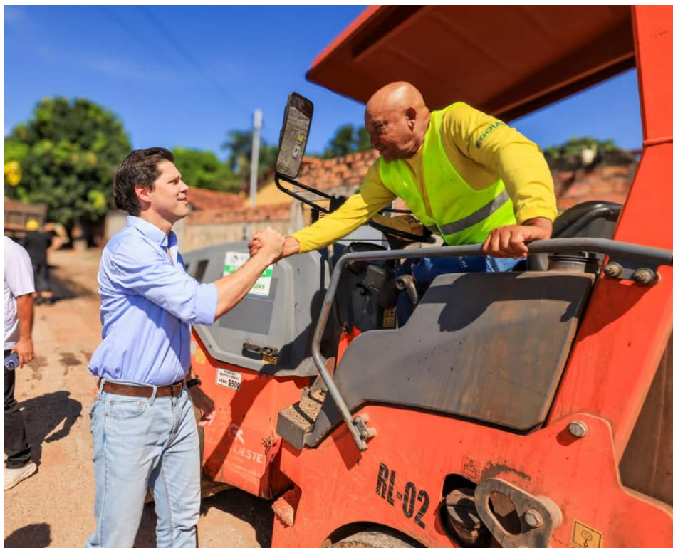
Daniel Vilela completa 30 dias à frente do governo de Goiás. Agenda focada em entregas nos municípios, desenvolvimento econômico e ações de segurança pública: “O trabalho seguirá em ritmo ainda mais acelerado para fortalecer Goiás. Foram 30 dias de dedicação diária aos goianos, e esse compromisso continuará”, afirma

Daniel Vilela assinou um pacote de medidas para fortalecer o setor de e-commerce no Estado. Como resultado, as operações da Shopee serão ampliadas no território goiano com previsão de criar até 3 mil novos empregos nos próximos anos. Ainda, o comércio eletrônico terá incentivos para atrair novos investimentos e viabilizar a simplificação de operações de comércio eletrônico em Goiás. Em atenção ao mercado global, o governador assinou a adesão de Goiás à Medida Provisória que prevê a subvenção ao óleo diesel, para