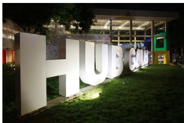
2ª Edição do programa GovTech busca soluções inovadoras para aprimorar a fiscalização tributária para o setor agrícola

cretarias de Ciência, Tecnologia e Inovação (Secti) e da Administração (Sead), com apoio do Hub Goiás, o programa GovTech permite ao poder público testar soluções antes de sua contratação definitiva. O modelo de CPSI possibilita o desenvolvimento, valida-