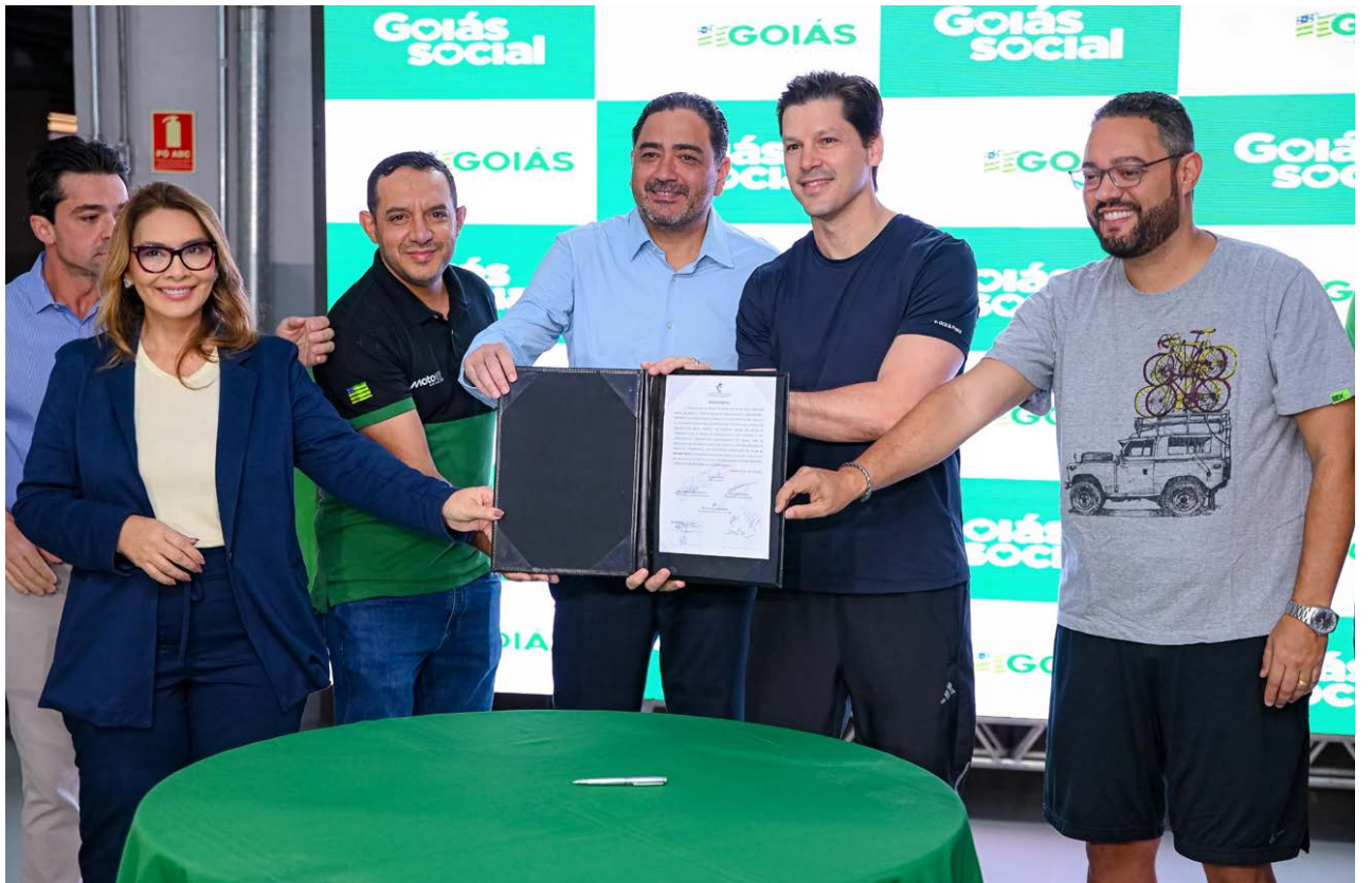
Aberto para ciclistas, Autódromo Internacional de Goiânia vai receber novo Centro Aquático

neste local, que é de extrema importância não só para a gente atleta de alto rendimento, como para a iniciação desportiva. É algo que em poucos lugares do Brasil se tem, e a gente tem esse privilégio aqui. Isso aqui é motivo de orgulho e gratidão”, ressaltou.