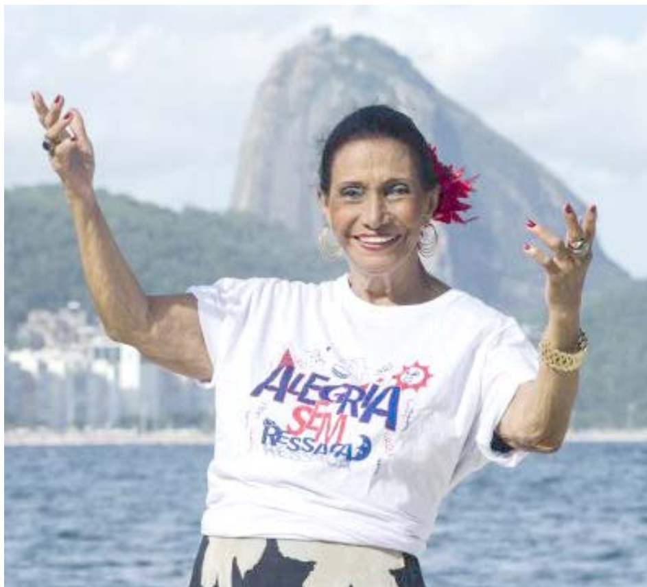
Alegria sem Ressaca

A Embaixadores da Alegria está com um grupo na