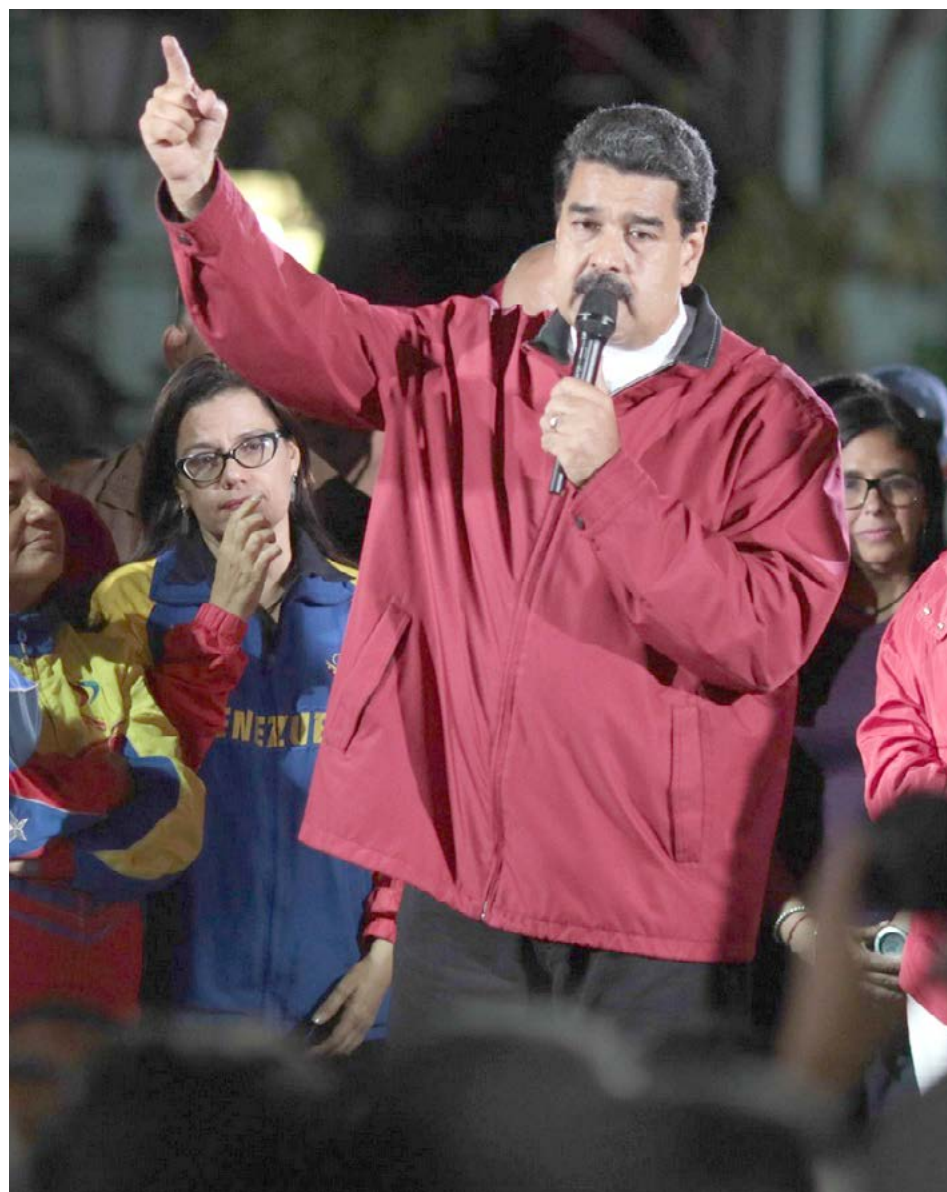
Governo da Venezuela

O chamado Grupo de Lima, que reúne vários países da região, entre eles o Brasil, publicou nota, afirmando que a decisão da Assembleia Nacional Constituinte de antecipar as eleições, normalmente marcadas no fim do ano, “impossibilita” a realização de um pleito democrático, transparente e confiável.