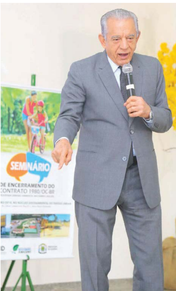
Prefeitura de Goiânia