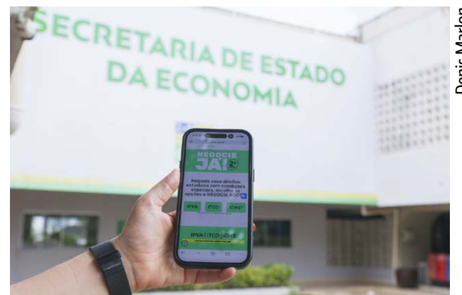
Adesão ao Programa Negocie Já 2 é totalmente digital e pode ser

O ICMS liderou a procura nos primeiros dois meses e meio de programa, com R$ 932,7 milhões em parcelamentos e R$ 111,34 milhões pagos à vista. Os proprietários de veículos também têm a oportunidade de negociar débitos de IPVA 2025 e anos anteriores. Conforme o último balanço, foram