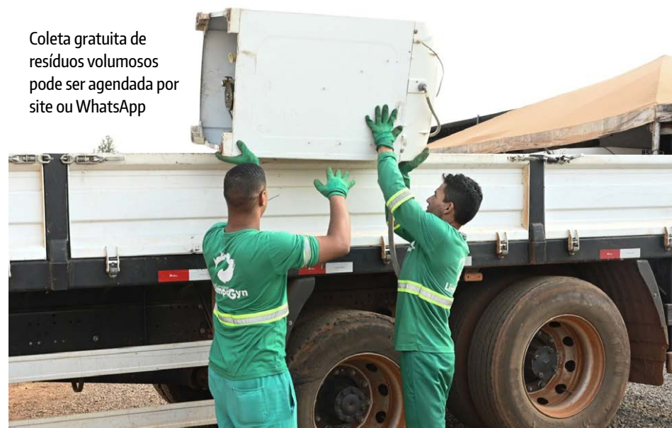
Coleta gratuita de resíduos volumosos pode ser agendada por site ou WhatsApp