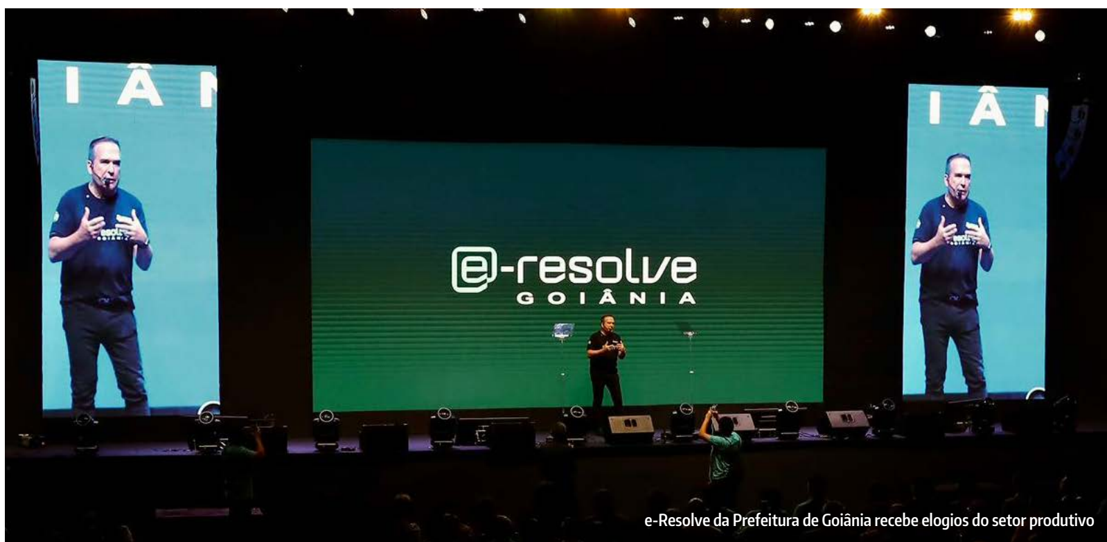
e-Resolve da Prefeitura de Goiânia recebe elogios do setor produtivo

A nova plataforma digital e-Resolve da Prefeitura de Goiânia recebeu avaliações positivas de entidades representativas de diferentes setores da economia. Apresentado na quarta-feira (15/4) pelo prefeito Sandro Mabel, o sistema foi destacado como um avanço na modernização da administração pública e na simplificação do acesso a serviços municipais.