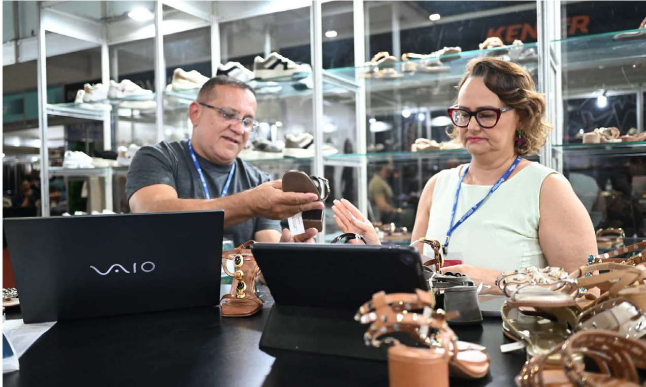
Dados da Juceg mostram crescimento contínuo de MEIs e empresas não MEIs abertas no Estado

Segundo relatório mensal da autarquia, as empresas não MEI somaram 13.353 formalizações no primeiro trimestre de 2026. No mesmo período de 2025, foram 12.689 aberturas, crescimento de 5,22%. Em 2024, o total ficou abaixo de 10 mil nos três primeiros meses