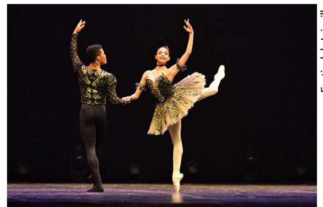
Festival de Joinville

política pública que faz de Goiás referência nacional na formação artística. “Goiás ocupa hoje o centro da cena cultural do país com uma escola pública que une talento, formação de excelência e oportunidade real para nossos jovens. O Basileu França mostra que investimento sério em educação, arte e inovação gera resultado, projeta o Estado no Brasil e no exterior e transforma vidas”.