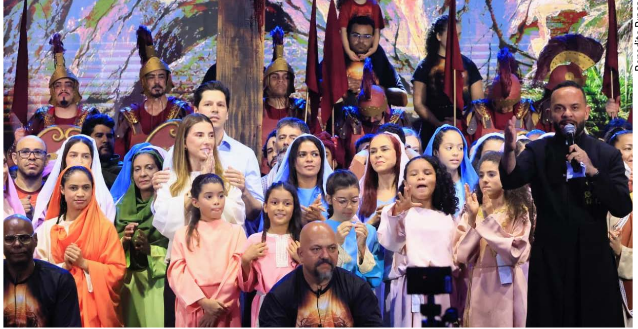
Governador Daniel Vilela acompanha encenação da Paixão de Cristo da Paróquia Nossa Senhora da Assunção, em Goiânia

A dramatização retratou passagens marcantes da vida de Jesus Cristo como a última ceia, o julgamento, o caminho do calvário, a crucificação e a ressurreição, e reforçou a mensagem de salvação e amor. O governador também lembrou que a Semana Santa marca outra grande responsabilidade em sua trajetória. “Tive o privilégio, a oportunidade concedida por Deus de assumir a condição de governar o Estado de Goiás