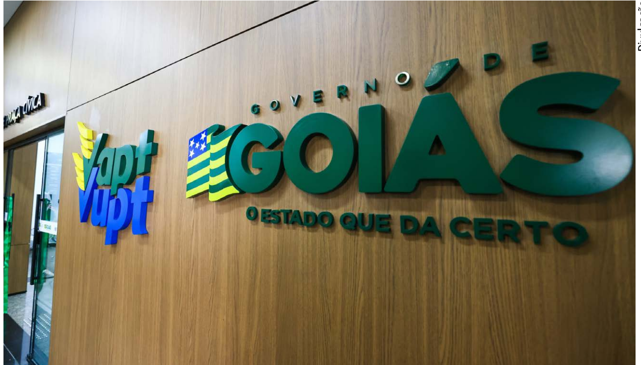
Unidades de Vapt Vupt funcionam em horário especial, na quinta-feira (2/4), das 8h às 13h; já na sexta-feira (3/4) e no sábado (4/4)

tecimento de Goiás (Ceasa) mantém funcionamento do mercado, com atendimento das 3h às 14h durante o feriado, exceto no domingo (5/4), quando não haverá expediente. As áreas administrativas entram em recesso na quinta-feira (2/4) e retornam na segunda-feira (6/4).