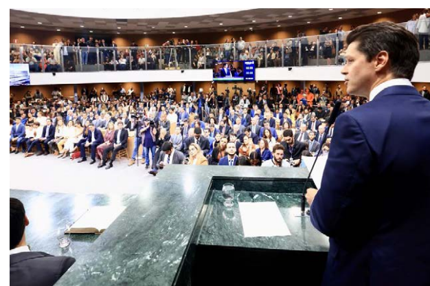
Daniel Vilela assume o governo de Goiás e reafirma compromisso de manter política de segurança que transformou Goiás no estado mais seguro do Brasil

Daniel Vilela destaca que os resultados são fruto de uma atuação estruturada, baseada em planejamento e investimentos contínuos, e reforça o compromisso de manter o apoio às forças de segurança. “Podem ter certeza que a melhor força de segurança do Brasil vai continuar tendo o mesmo apoio, o mesmo respaldo do governador do estado. É tolerância zero com a bandidagem e cuidado pleno com o cidadão de bem”, declarou.