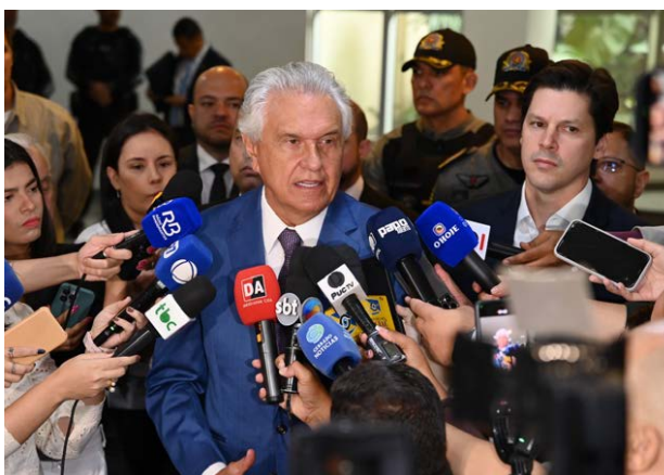
Trabalho para recompor as contas públicas, tratado como prioridade, desde 2019, pelo governador Ronaldo Caiado, viabilizou R$ 23,7 bi em investimentos ao longo dos dois mandatos

A virada de chave, detalhou o governador, foi motivada pelo compromisso de restituir a presença do Governo junto à popu-