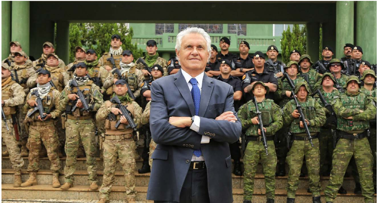
“A primeira tese que defendi quando assumi foi: ‘ou bandido muda de profissão, ou muda de Goiás’”, lembra o governador Ronaldo Caiado ao comentar a queda sustentada da criminalidade a partir de 2019

em integração entre as forças de segurança, reestruturação de carreiras, ampliação de investimentos e mudanças no sistema penitenciário. A estratégia foi definida como prioridade no início da gestão.