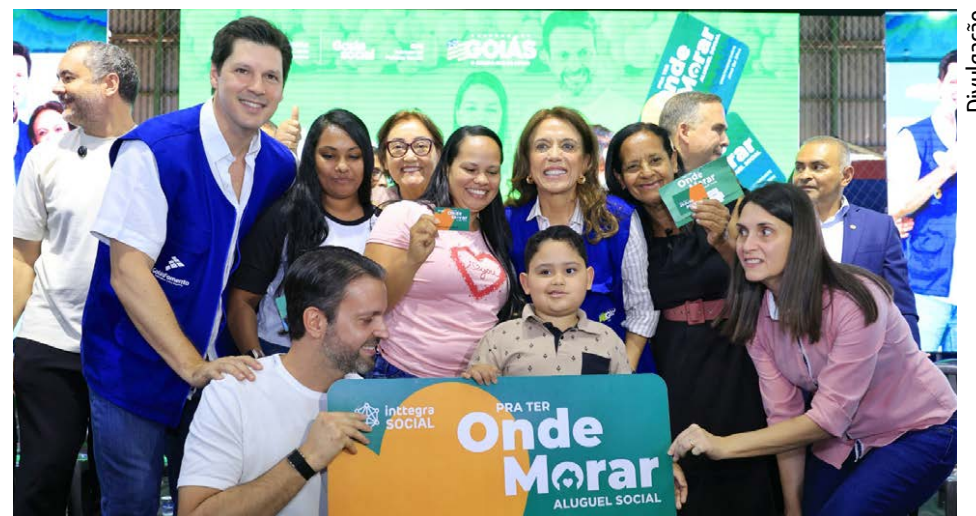
Atendimento prioritário a mulheres evidenciando a atenção do Governo de Goiás ao público feminino

ras, a preferência é que o documento seja registrado no nome da mulher. Em caso de separação, o título permanece com ela ou com o responsável pela guarda unilateral dos filhos, garantindo maior segurança jurídica e social às famílias chefiadas por mulheres. “Essas mudanças refletem o compromisso do Governo