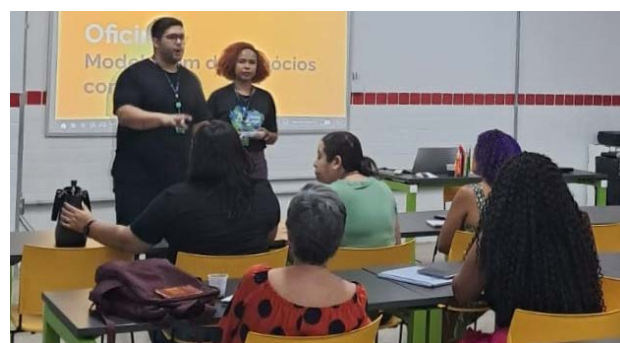
Inscrições para programa Goianas S.A. seguem abertas até dia 4 de fevereiro. Iniciativa estimula o empreendedorismo feminino nas áreas de ciência, tecnologia e inovação

Serão selecionados até 20 projetos liderados por mulheres goianas, com foco na incubação de empresas e no desenvolvimento de produtos e serviços inovadores. De acordo com o secretário de Estado de Ciência, Tecno-