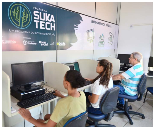
Goiás Social abre 225 vagas em Goiânia e 114 em Senador Canedo, para cursos gratuitos de tecnologia

Em Senador Canedo, são 114 vagas distribuídas entre as unidades Ganha-Tempo Vila Galvão e Ganha-Tempo Jardim das