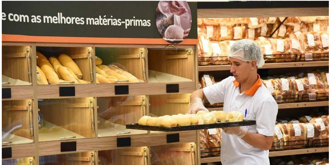
Ampliação da Lei de Liberdade Econômica reduz entraves para abertura e funcionamento de empresas nos municípios goianos