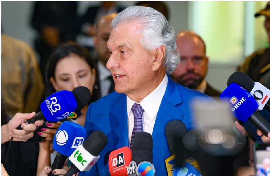
Apresentação de índices criminais reúne autoridades e representantes das polícias goianas

“Quando eu disse que bandido não se cria em Goiás; ou muda de profissão, muda do estado, está aí. Não é discurso, é a realidade. Essa radiografia explicita tudo. Nós devolvemos Goiás aos goianos”, celebrou Caiado. “Os resultados são surpreendentes do ponto de vista do avanço da segurança pública