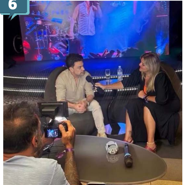
Zeze di Camargo e Mabell Reipert