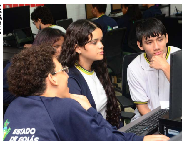
Escolas do Futuro estão com 647 vagas abertas para cursos de nível técnico para áreas como Marketing e Mídias Sociais e Empresas Digitais

A seleção será realizada a partir do ranqueamento da média global das notas obtidas no último ano do Ensino Médio concluído ou por meio da média das notas alcançadas nas