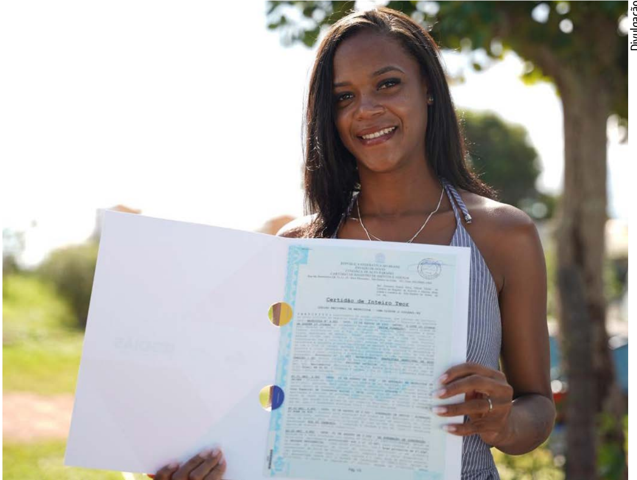
Programas habitacionais da Agehab transformam a realidade de famílias no Nordeste de Goiás

vestindo R$ 75 milhões apenas em casas a custo zero na região, um montante histórico que movimenta a economia local e gera cidadania. Cada escritura entregue e cada chave na mão representam o compromisso da gestão estadual em não deixar nenhum goiano para trás”, conclui.