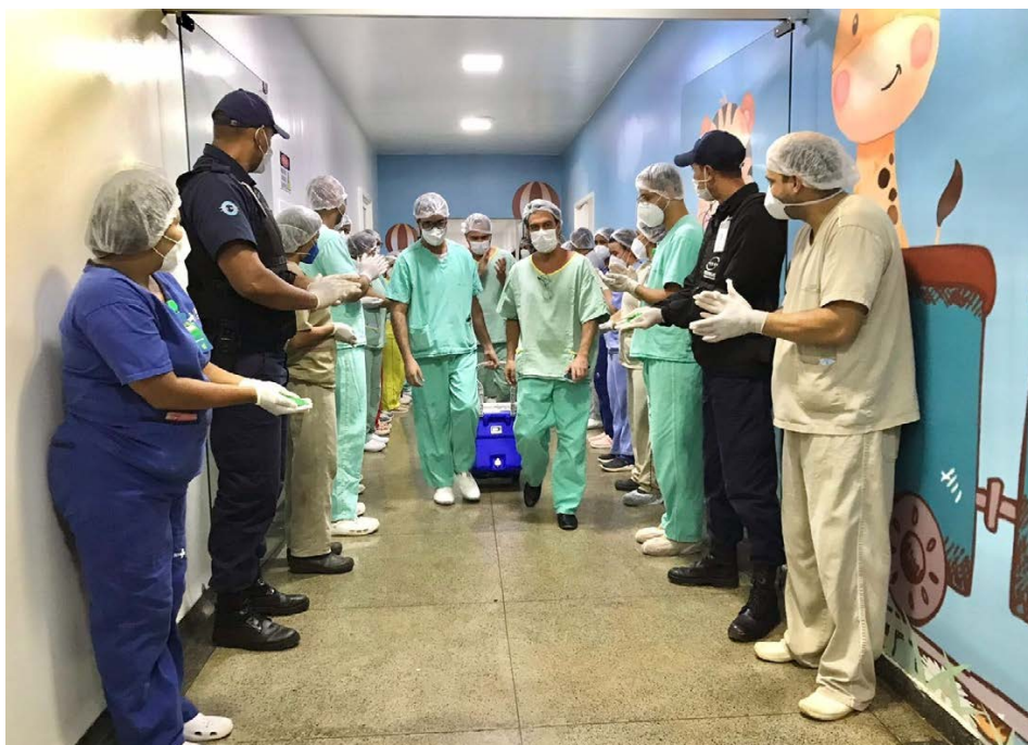
Governo amplia transplantes de alta complexidade, com crescimento de 25% nos procedimentos

Dados da SES também revelam aumento de 20,5% no número de transplantes de rins em 2025, na comparação com 2024