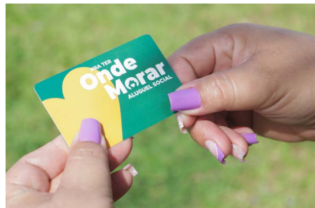
Governo de Goiás convoca mais 52 mulheres em situação de violência doméstica para o programa Aluguel Social

De acordo com Baldy, a equipe técnica social da Agehab intensificou ações junto aos diversos atores da rede de proteção, com foco na ampliação do acesso ao programa. As estratégias incluem a integração e capacitação de gestores e equipes técnicas municipais, por meio de reuniões institucionais destinadas ao esclarecimento dos objetivos do Aluguel Social e