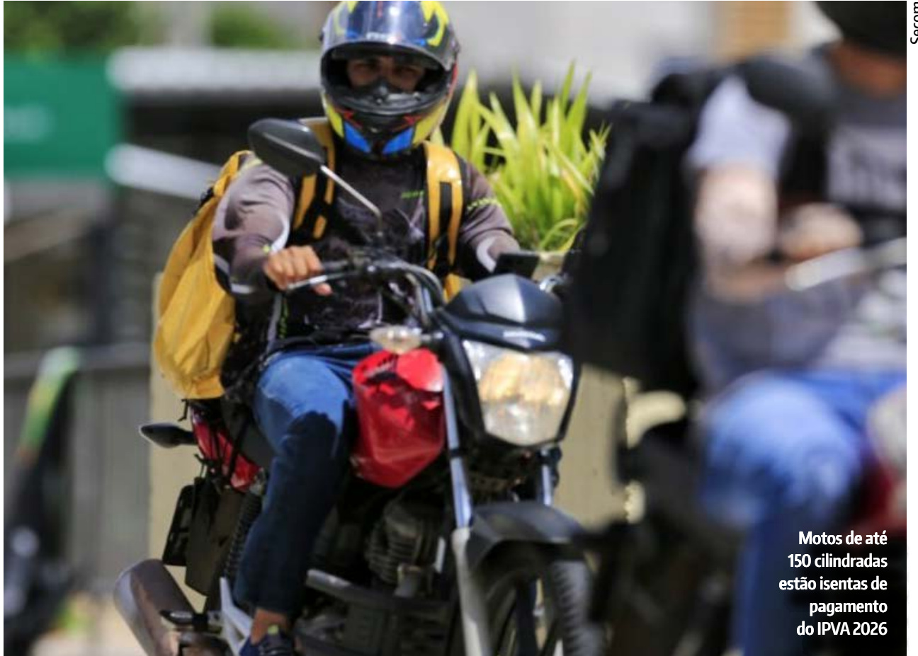
Motos de até 150 cilindradas estão isentas de pagamento do IPVA 2026

Para motocicleta, ciclomotor, triciclo e motoneta de até 125 cilindradas e com menos de seis anos de uso, há a redução da base de cálculo de 50%. Para garantir o desconto de 50% no IPVA, o condutor não pode ter infração de trânsito, deve estar com o licenciamento em