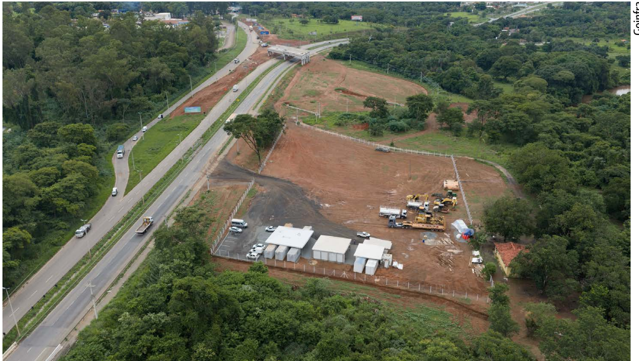
Obras do viaduto na GO-020, entre Goiânia e Senador Canedo, avançam e devem ser concluídas no segundo semestre

Os serviços remanescentes contemplam a execução dos aterros reforçados de acesso, das alças de retorno, implantação de obras de arte correntes, drenagem e sinalização. Com objetivo de melhorar a trafegabilidade e dar mais segurança viária em trecho de acesso