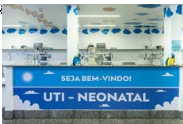
Unidade oferece atendimento especializado, com a presença dos pais 24 horas, promovendo o vínculo afetivo desde os primeiros momentos de vida

O HCN também se destaca como referência em captação de órgãos, tendo realizado 32 procedimentos. Em 2025, o HCN alcançou mais um marco que o consolidou como referência no estado: a certificação da Organização Nacional de Acreditação (ONA), que reforça o compromisso do hospital com