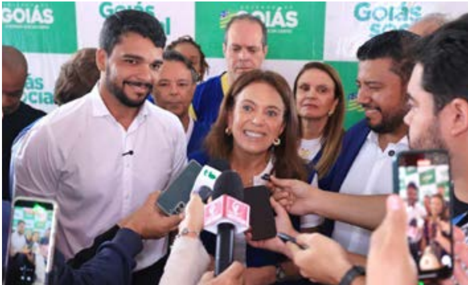
Mais esporte e inclusão para Trindade: Governo garante aulas gratuitas de modalidades de areia

Ao todo, o Estado investiu R$ 210 mil na aquisição de materiais esportivos entregues em Trindade, sendo R$ 60 mil para o Viva Mais Goiás, que atende o público adulto e da terceira idade com atividades como hidroginástica, ginástica funcional, pilates, yoga e dança. O Goiás Bom de Bola, focado nas pessoas em situação de vulnerabilidade social, recebeu R$ 40 mil em artigos voltados às modalidades de bas-