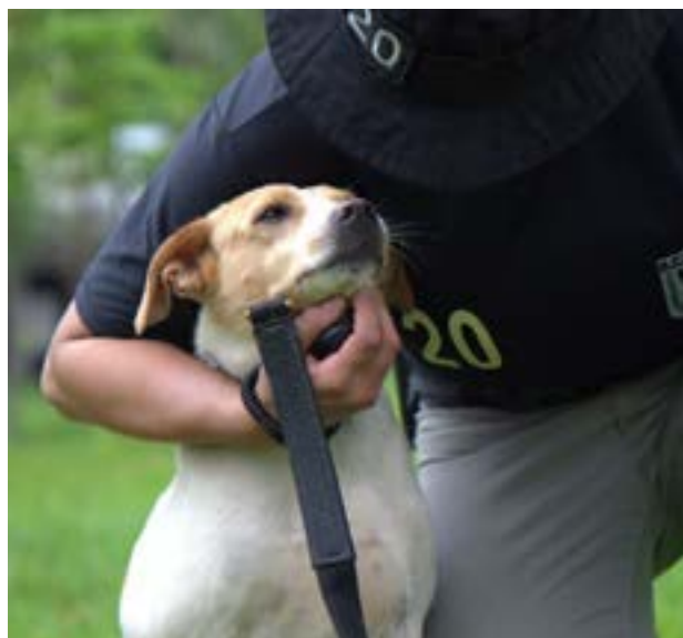
Policias militares adestraram cães resgatados das ruas de Goiânia que serão doados à população

Durante o curso, os cães receberam tratamento veterinário completo, incluindo castração, vermifugação, desparasitação, microchipagem e carteira de identidade animal. O adestramento foi conduzido com metodologia positiva, utilizando técnicas baseadas em condicionamento clássico e operante, voltadas ao desenvolvimento de obediência, equilíbrio comportamental e socialização.