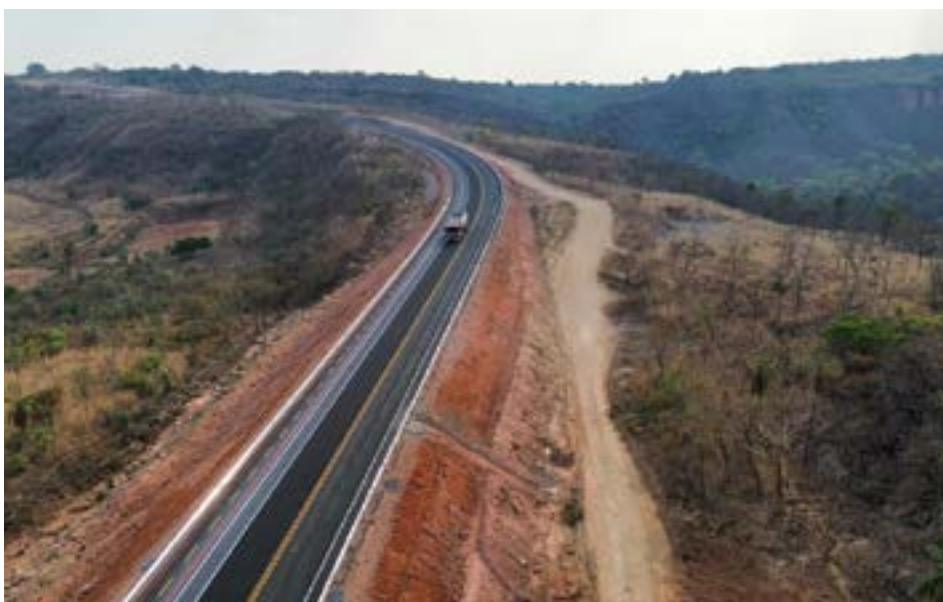
Governo de Goiás deve entregar ainda este mês a conclusão da obra na rodovia que liga o município de Guarani de Goiás e ao Parque Estadual de Terra Ronca