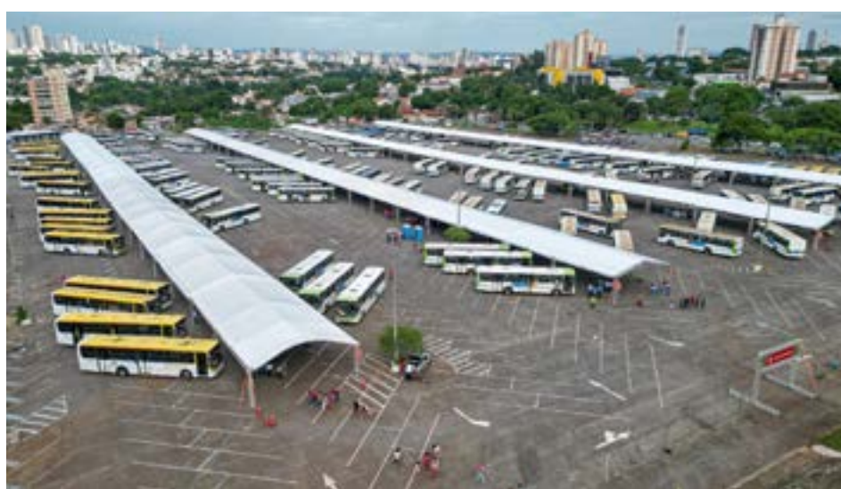
Rotas gratuitas levarão famílias ao Ginásio Goiânia Arena para participar da tradicional entrega de brinquedos do Natal do Bem, realizada pela OVG e pelo Goiás Social

Ao todo, 20 mil brinquedos serão distribuídos na capital, entre bonecas, carrinhos que se transformam em patrola, bolas de futebol e vôlei, kits de panelinha e o novo jogo imobiliário personalizado com pontos turísticos de Goiás. Em 2025, o Governo de Goiás adquiriu 665 mil brinquedos, destinados aos 246 municípios goianos, com investimento de R$ 26,8 milhões. Desde 2019, já são mais de 3,2 milhões de brinquedos entregues em todo o estado.