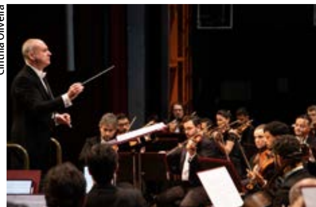
A Orquestra Filarmônica de Goiás leva ao público concerto do período romântico para finalizar a temporada de 2025

Para o maestro, a Temporada Pioneiros cumpriu o papel de aproximar ainda mais o público do universo sinfônico. “2025 foi maravilhoso. A Filarmônica deu mais um passo e segue crescendo musicalmente, algo reconhecido pelo público, pelos músicos convidados e por maestros que passaram por aqui. A cada concerto vimos o entusiasmo da plateia, que se co-