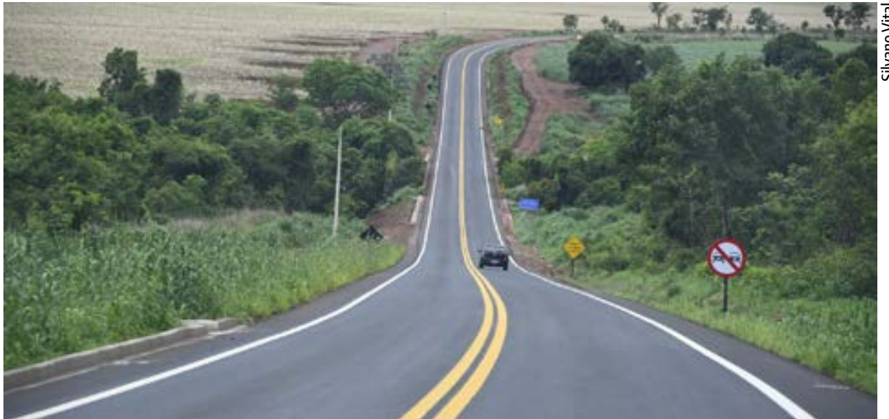
Concluída em prazo recorde, a restauração dos quase 100 quilômetros da GO-184 recebeu investimento de mais de R$ 276,6 milhões