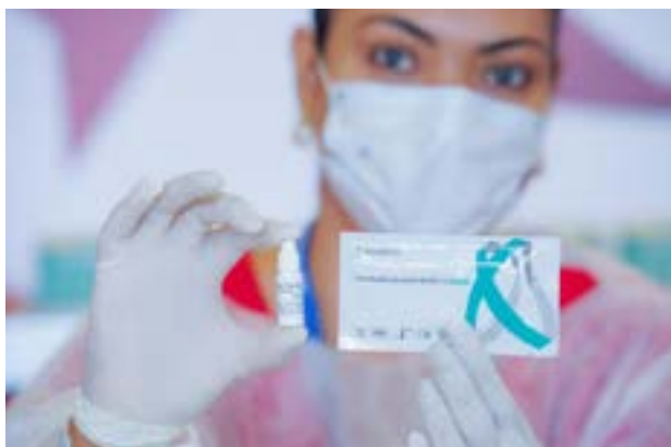
Governo de Goiás divulga números sobre HIV e Aids de 2015 a 2025; testagem rápida e sigilosa é apenas uma das estratégias de prevenção oferecidas pelo SUS

Entre 2015 e 2025, conforme dados da Subsecretaria de Vigilância em Saúde da SES, Goiás registrou 25.100 casos de HIV e Aids em adultos. A boa notícia é que os casos de Aids, que representam a fase avançada da infecção, continuam caindo, assim como o número de óbitos, que teve redução significativa