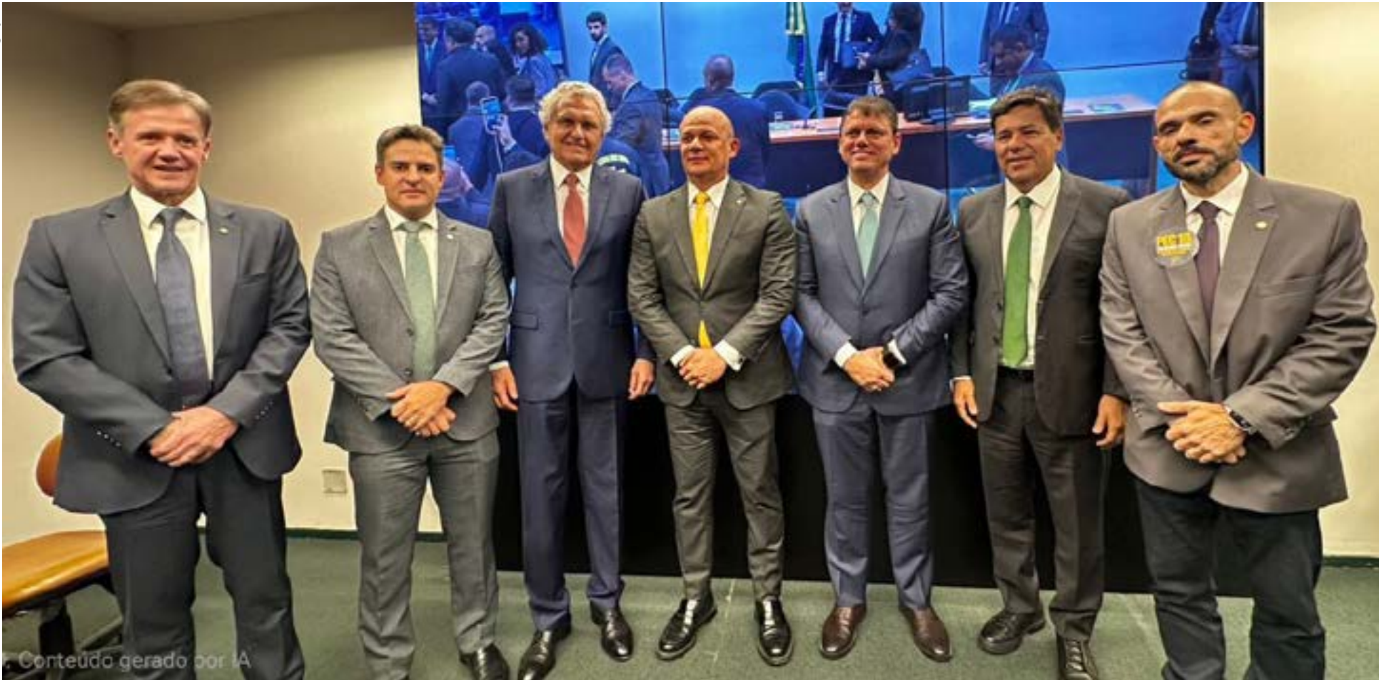
Conteúdo gerado por IA