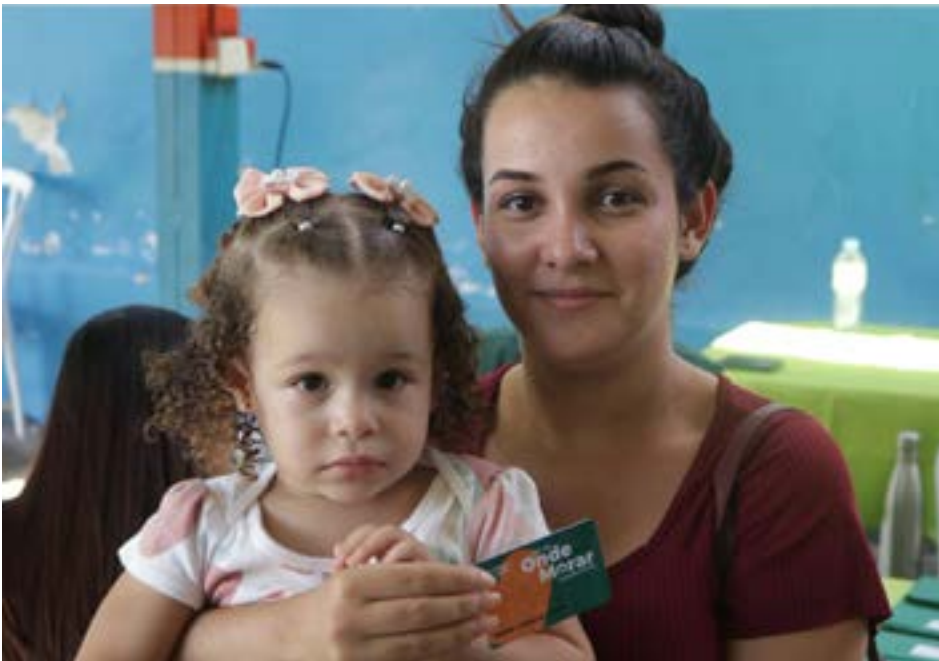
Pelo Aluguel Social, a família recebe o pagamento mensal de R$ 350, por 18 meses