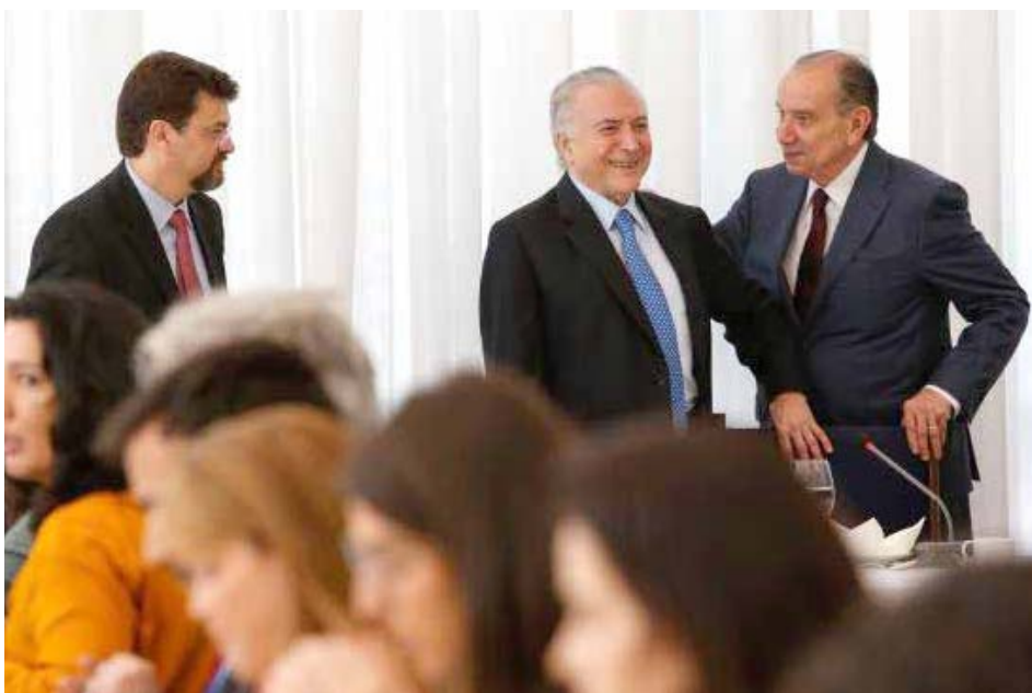
O presidente Michel Temer participa do café da manhã com jornalistas do Comitê de Imprensa do Palácio do Planalto

O presidente Michel Temer comentou o cenário eleitoral para 2018 e disse que os brasileiros querem um candidato "comprometido com a política de resultados" e que leve adiante as reformas estruturais do país.