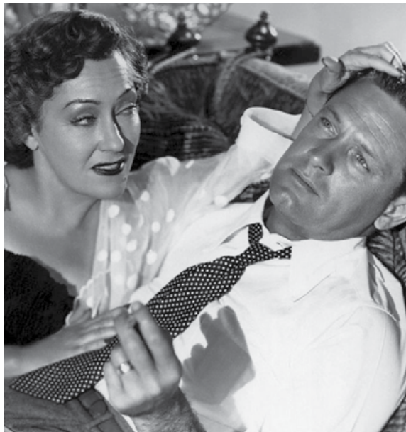
Cena do clássico "Crepúsculo dos Deuses"

Nos dias 24 e 25, o cinema estará de recesso de Natal, bem como no período de 30/12 a 01/01/2018, em recesso de fim de ano. O Cine Cultura é uma unidade da Secretaria de Educação, Cultura e Esporte (Seduc) e funciona no prédio do Centro Cultural Marieta Telles Machado, na Praça Cívica.