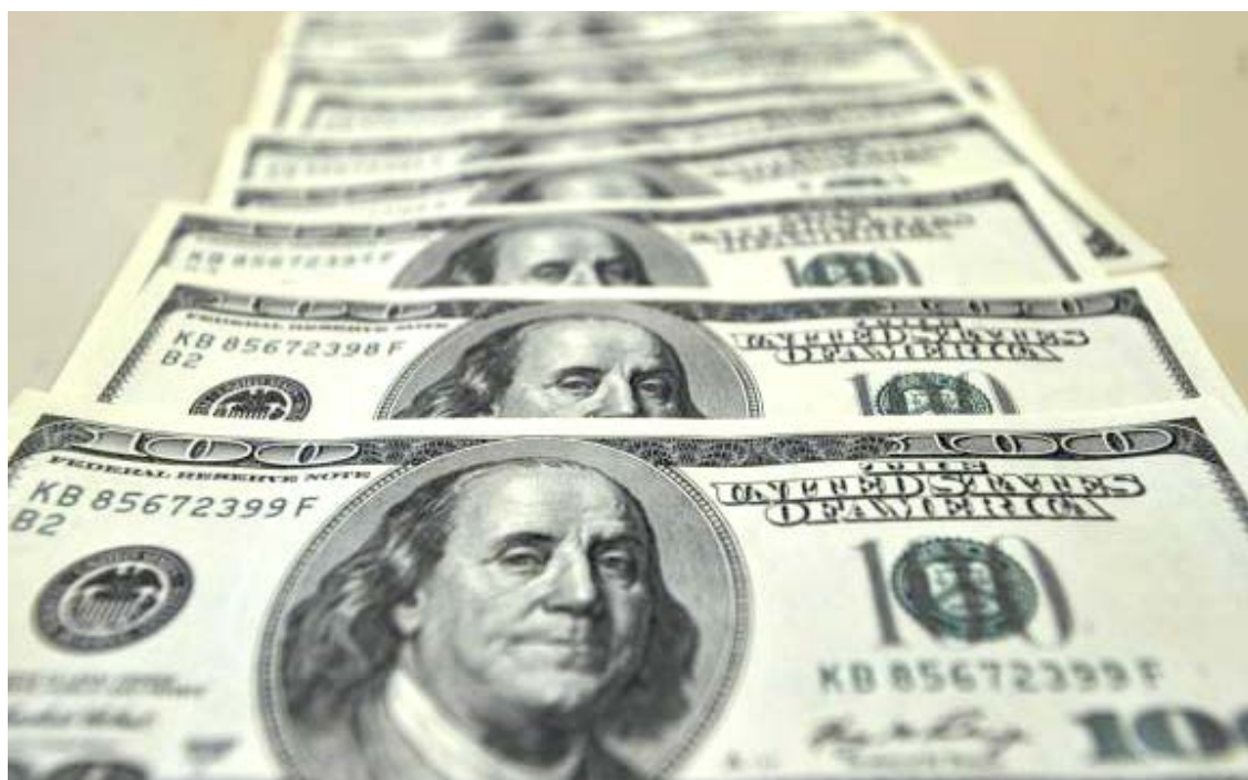
Contas externas devem fechar o ano com saldo negativo de US$ 18,4 bilhõesM

Rocha explicou que em 2018 o déficit em transações correntes (US$ 18,4 bilhões) será maior do que deste ano (US$ 9,2 bilhões) devido à retomada da atividade econômica, o que leva a aumento da demanda doméstica por importações, mais remessas ao exterior devido ao crescimento da lucratividade e maiores gastos em viagens ao exterior pelos brasileiros e com transporte pelas empresas.