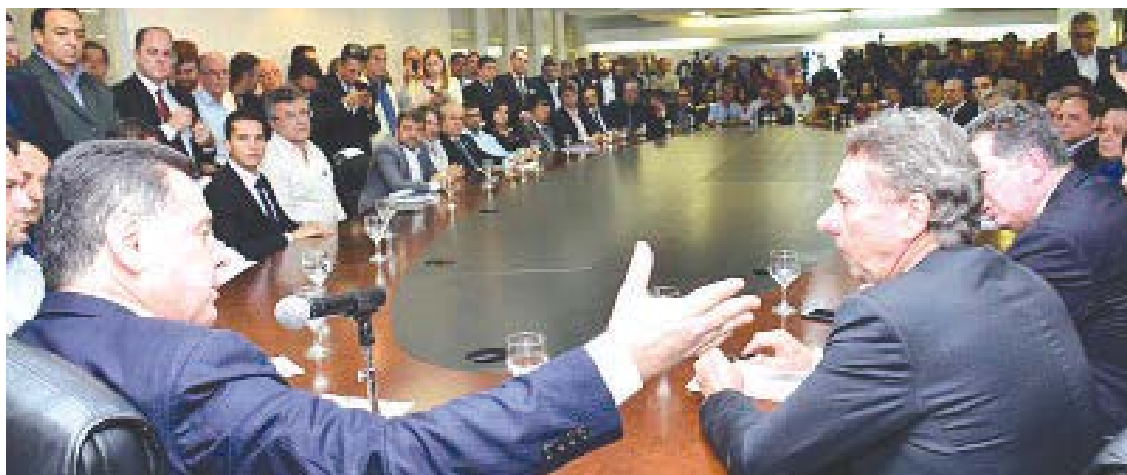
Assessoria do Governador

Destacam-se entre os projetos assinados hoje, a instalação da Jac Motors em Itumbiara, com investimentos de R$ 160 milhões e prospecção de geração de 800 empregos diretos e indiretos. E a instalação da Jataí Agroindústria de Biocombustível, no município