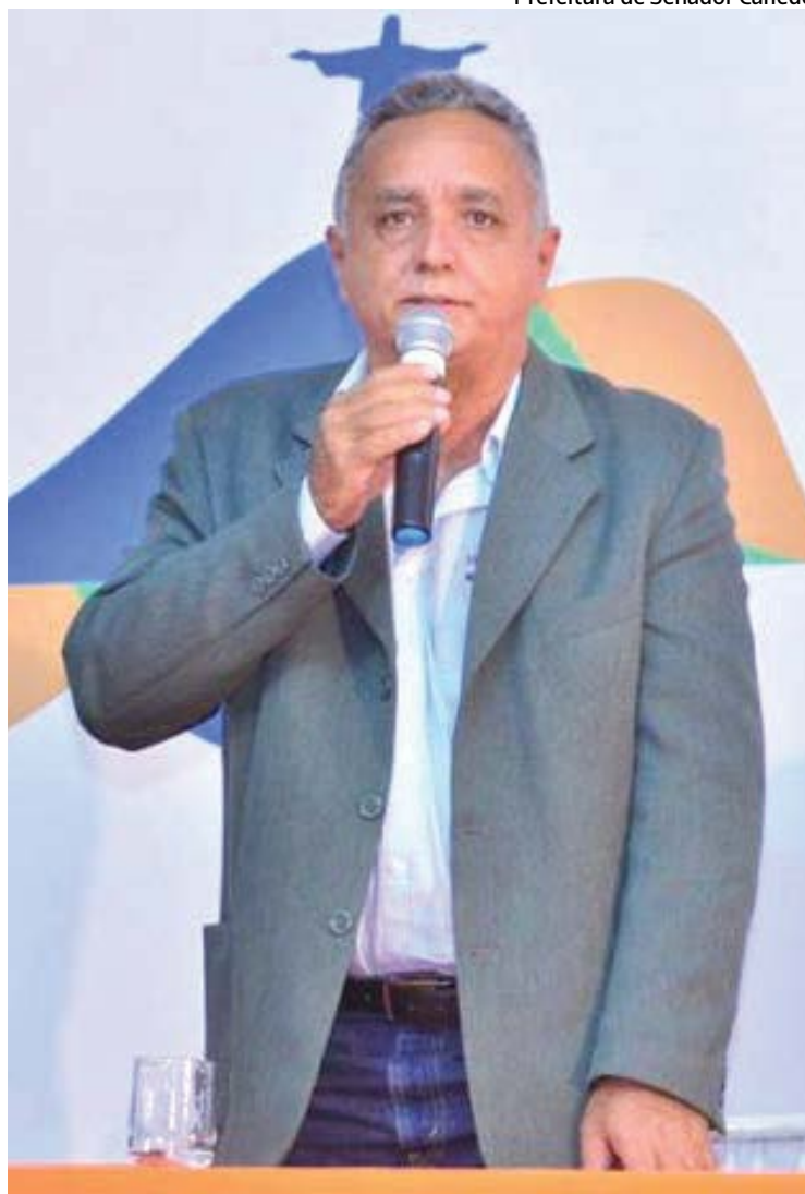
Prefeitura de Senador Canedo

A Prefeitura de Senador Canedo executou neste ano a primeira etapa de um Amplo Programa de Asfaltamento de Ruas e de implantação de infraestrutura urbana, com rede de galerias pluviais e meio fios, em diferentes partes do município. Foram mais de 15.500 toneladas de asfalto que recuperaram ruas com asfaltamento deteriorado e asfaltaram outras novas como no Residencial Recanto das Oliveiras e no Residencial Jardim