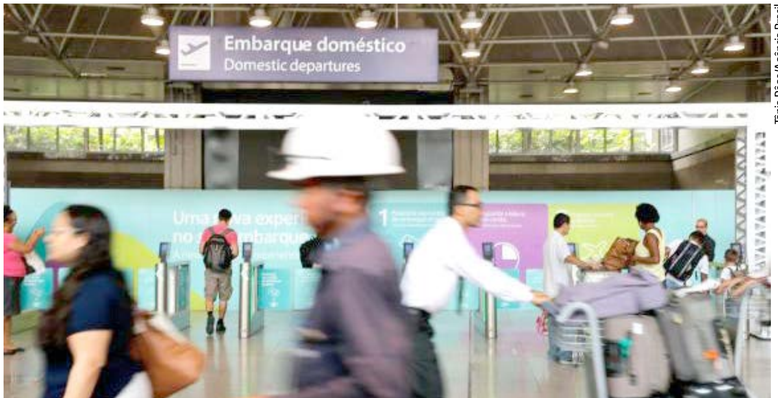
Polícia Federal fez uma operação contra esquema de tráfico internacional de drogas e descaminho de mercadorias dentro do Aeroporto do Galeão

Ainda de acordo com a PF, o grupo se dividia em três núcleos. Um deles era responsável