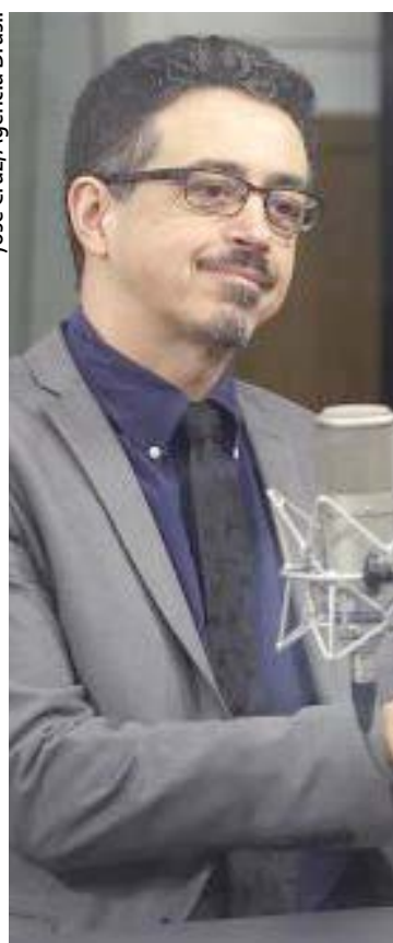
Brasília - O programa Por Dentro do Governo, da TV NBR, entrevista o ministro da Cultura, Sérgio Sá Leitão

O ministro da Cultura, Sérgio Sá Leitão, disse que o governo está elaborando um projeto de lei para destinar recursos das loterias federais para projetos culturais. “Diretamente da Caixa para os proponentes. Isso vai ser um programa de fomento à cultura na ordem de R$ 350 milhões. O maior que já foi feito na história do país”, disse Leitão.