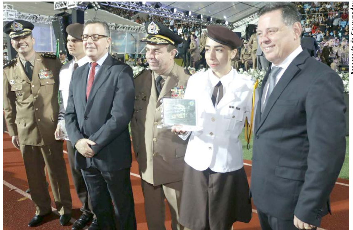
Assessoria do Governador

“Na redondeza dessa escola havia tráfico de drogas. Isso acabou imediatamente quando foi transformada em colégio militar”, lembrou. “Estamos entregando para a sociedade alunos muito bem formados, que estão entre os melhores das escolas públicas do Brasil. Alunos comprometidos com a educação que democratize oportunidades a todos. Tenho orgulho de ter criado cada um dos 36 colégios milita-