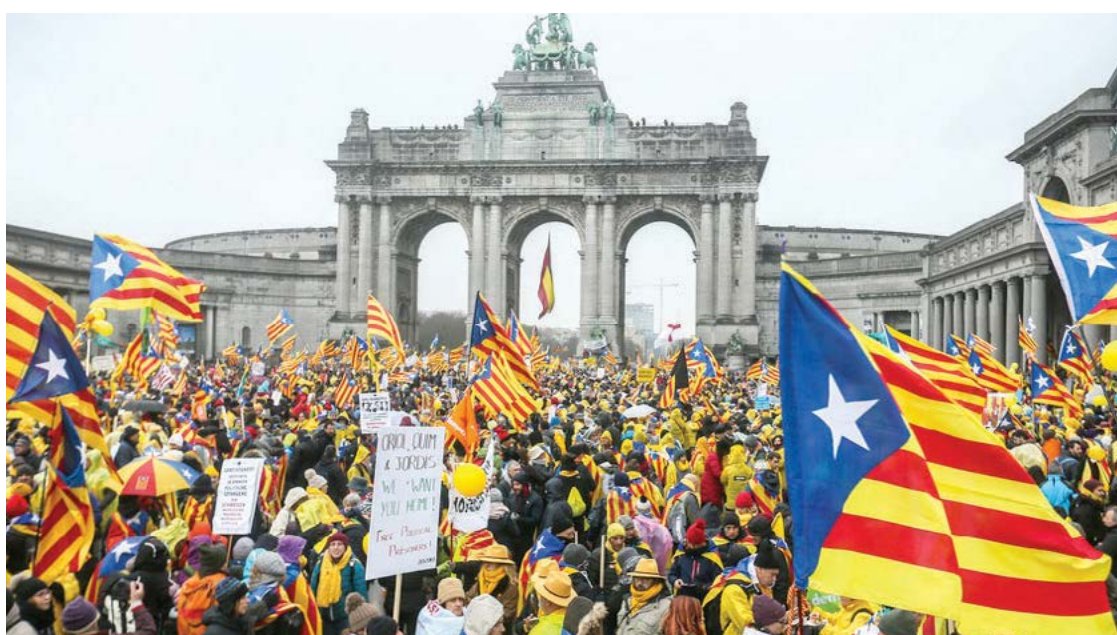
Milhares de pessoas marcham pela independência da Catalunha, em Bruxelas

Os manifestantes - catalães e simpatizantes da causa separatista - defendem a declaração de independência da região e a instauração de uma república na Catalunha. Além disso, pedem