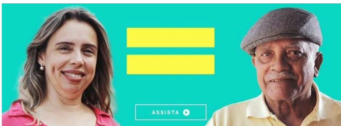
Imagem da campanha "combate aos privilégios"; anúncios foram proibidos em todo o país

Após a decisão, a Advocacia-Geral da União (AGU) informou que vai recorrer da decisão.