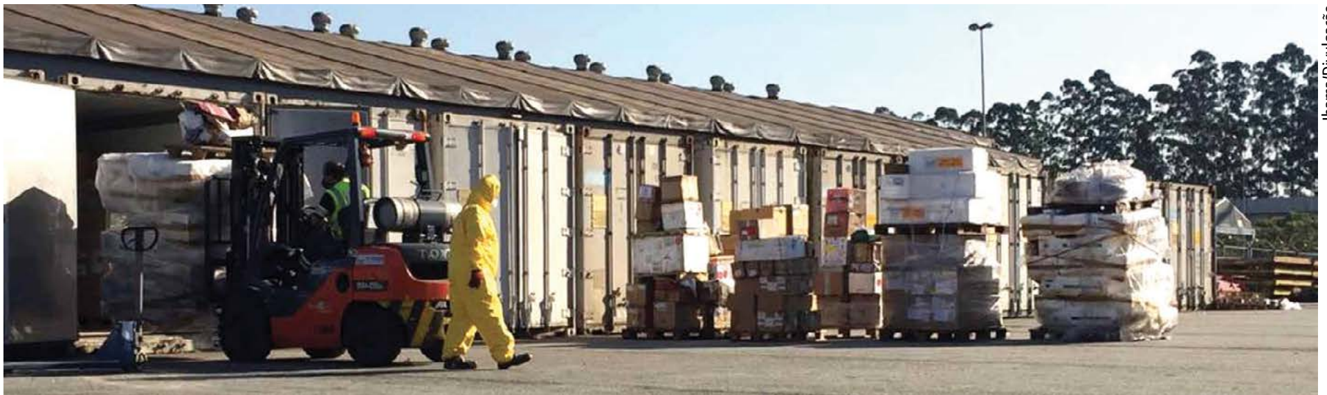
Carga de 10 toneladas de peixe será removida do Aeroporto Internacional de Guarulhos, na Grande São Paulo, após ficar cinco anos abandonada

A Latam informou, em nota, que a incineração do material seguirá a legislação e exigências dos órgãos competentes