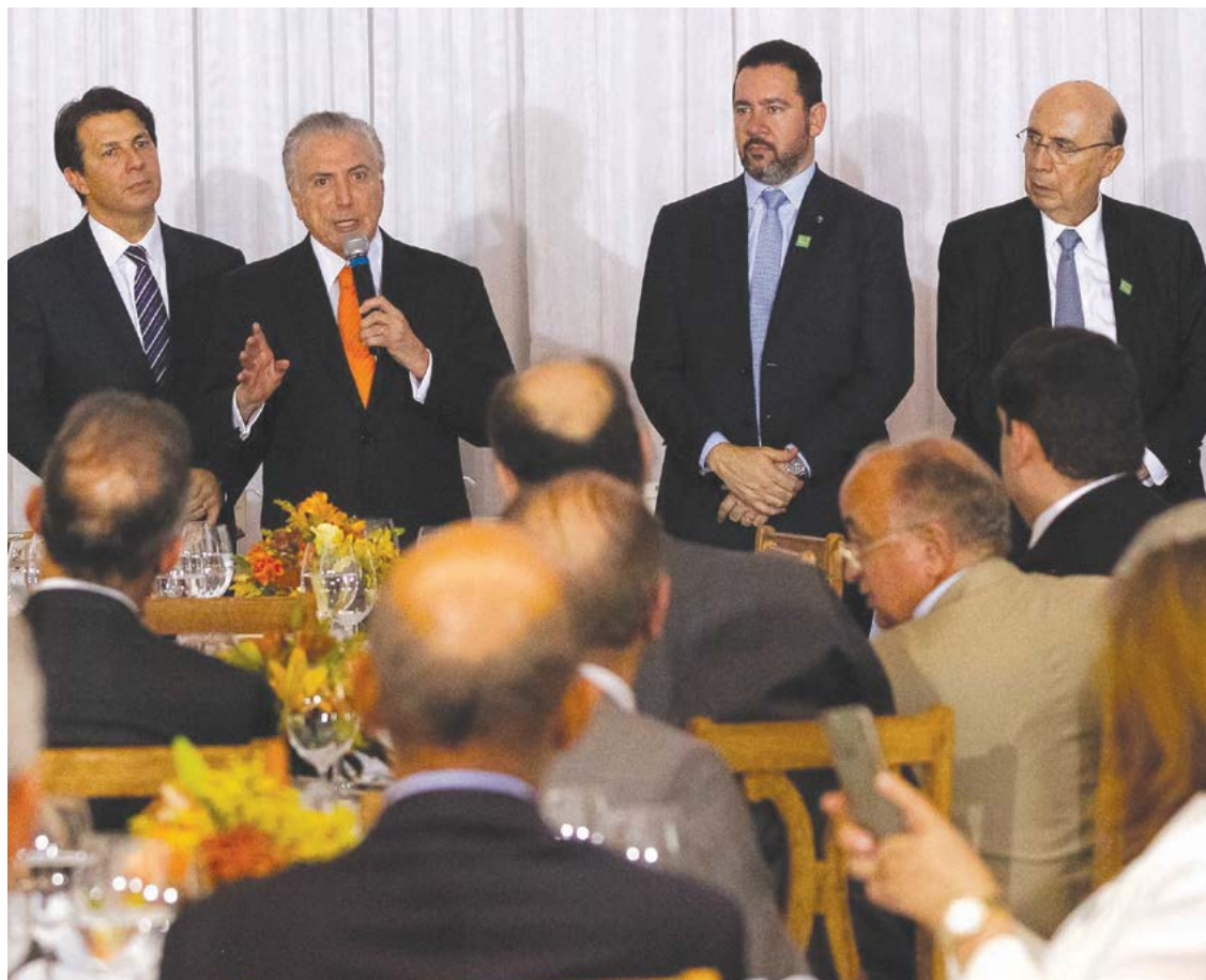
O presidente Michel Temer falar em jantar com deputados da base aliada para apresentar o novo texto da reforma da Previdência

O texto prevê critérios diferenciados para professores, que poderão se aposentar a partir dos 60 anos, policiais e categorias que apresentam condições