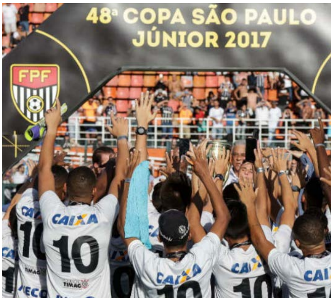
Corinthians defenderá seu título da Copinha

Já o Vila Nova está no Grupo 16, em Itu, e enfrenta o Ituano (SP), XV de Piracicaba e Santa Cruz (AL).