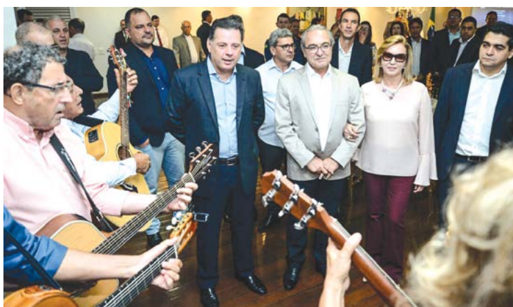
Lançamento do V Festival Gastronômico de Trindade, no Palácio das Esmeraldas