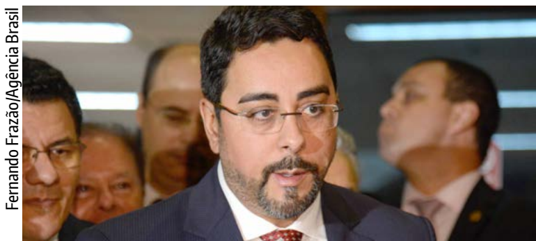
Juiz Marcelo Bretas, da 7ª Vara Federal Criminal

A Operação C'est fini, deflagrada no Rio pela Polícia Federal (PF), cumpriu todos os cinco mandados de prisão preventiva, pedidos pelo juiz Marcelo Bretas, da 7ª Vara Federal Criminal. Segundo a PF, a ação ocorreu com base na delação premiada de Carlos Bezerra, um dos operadores da organização criminosa chefiada pelo ex-governador Sérgio Cabral.