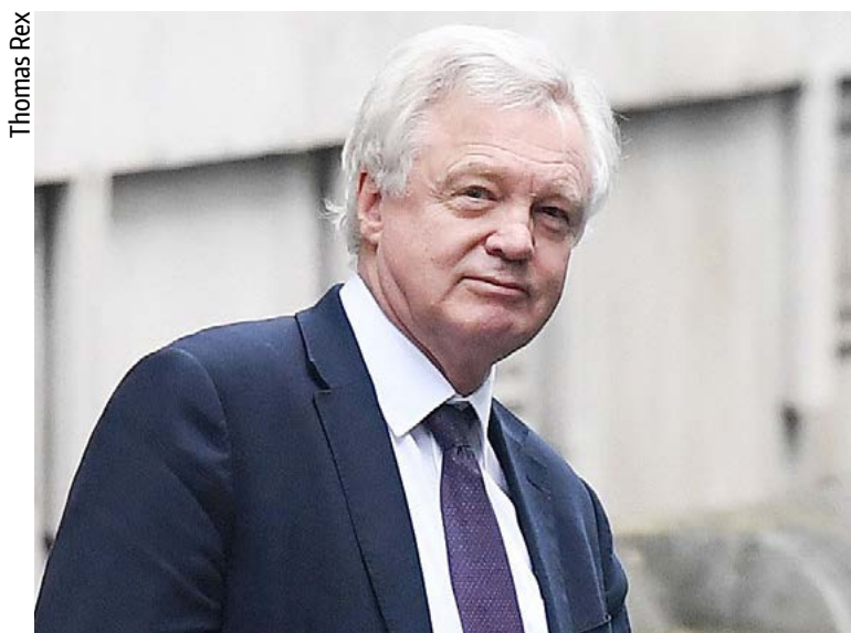
Ministro David Davis

O Governo do Reino Unido tramita 313 projetos e mil normativas relacionadas com o processo de saída da União Europeia (UE), o Brexit, revelou o Escritório Nacional de Auditoria (NAU, na sigla em inglês). A informação é da Agência EFE.