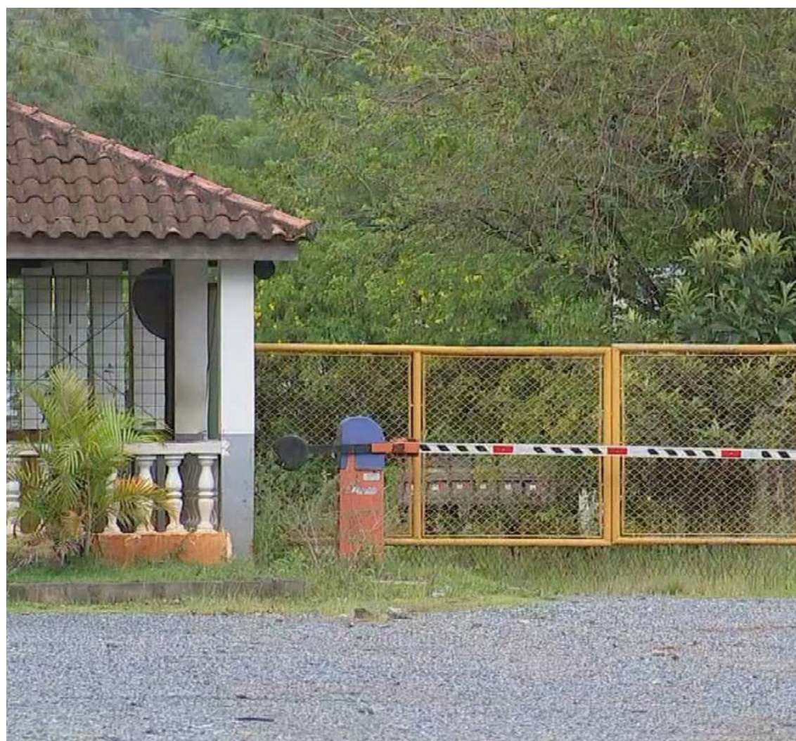
Criminosos renderam funcionários e roubaram mineradora em Salto de Pirapora

Oficiais do Exército e da Polícia Civil fizeram uma vistoria no local do crime. Ninguém foi preso até o momento.