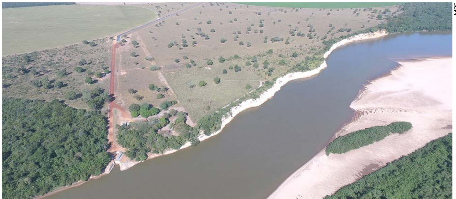
Entre as irregularidades citadas na ação estão a captação de água diretamente do Rio Araguaia, sem a devida licença ambiental de funcionamento

Em um dos processos, a Secima conseguiu convencer o desembargador que havia concedido liminar, a revogar a decisão, após demonstrar que,