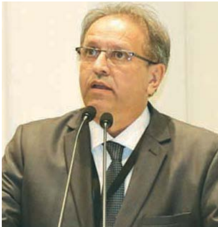
Governador do Tocantins, Marcelo Miranda (PMDB)

Na oportunidade, foi anunciada a criação do Comitê de Proteção à Amazônia (Copal), que terá como objetivo preservar, prevenir, conservar e proteger o bioma Amazônia, especialmente no combate às queimadas.