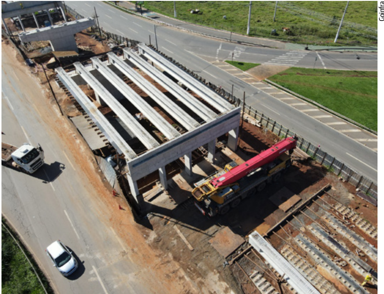
Obras do Viaduto Portal da Fé avançam com a instalação de 18 vigas de sustentação

De acordo com o presidente da Goinfra, general Antônio Leite dos Santos Filho, o empreendimento foi planejado para facilitar o escoamento do tráfego de 47 mil veículos que passam diariamente pelo entroncamento da GO-060 com a GO-469. "O viaduto Portal da Fé proporcionará