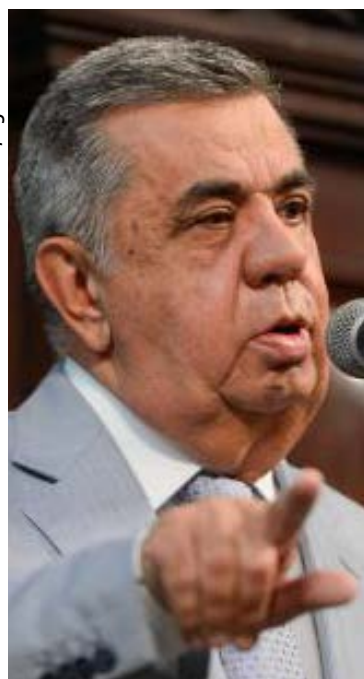
Deputado Jorge Picciani é um dos alvos da operação deflagrada no Rio de Janeiro