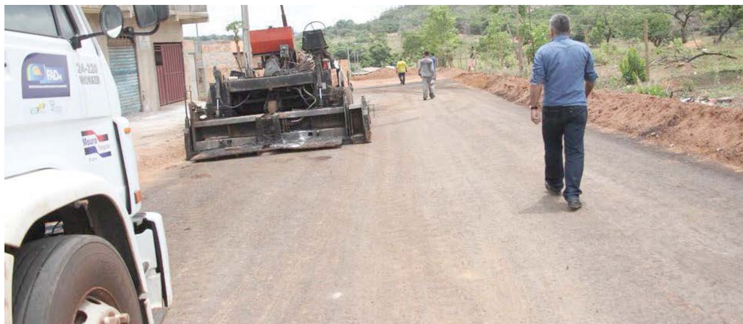
Prefeitura de Senador Canedo

Na atual gestão, o investimento no “Senador Canedo – Uma Nova Cidade” está sendo de