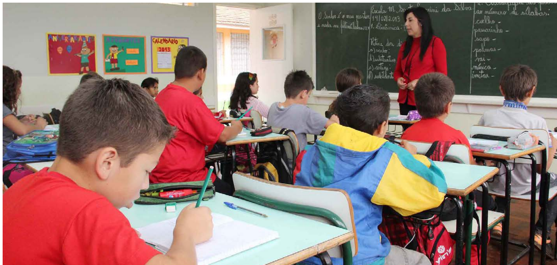
Prefeitura Municipal de Castro

O Ministério da Educação (MEC) divulgou na quarta-feira (25), dados preocupantes sobre o nível de aprendizado de alunos do terceiro ano do ensino fundamental no Brasil.