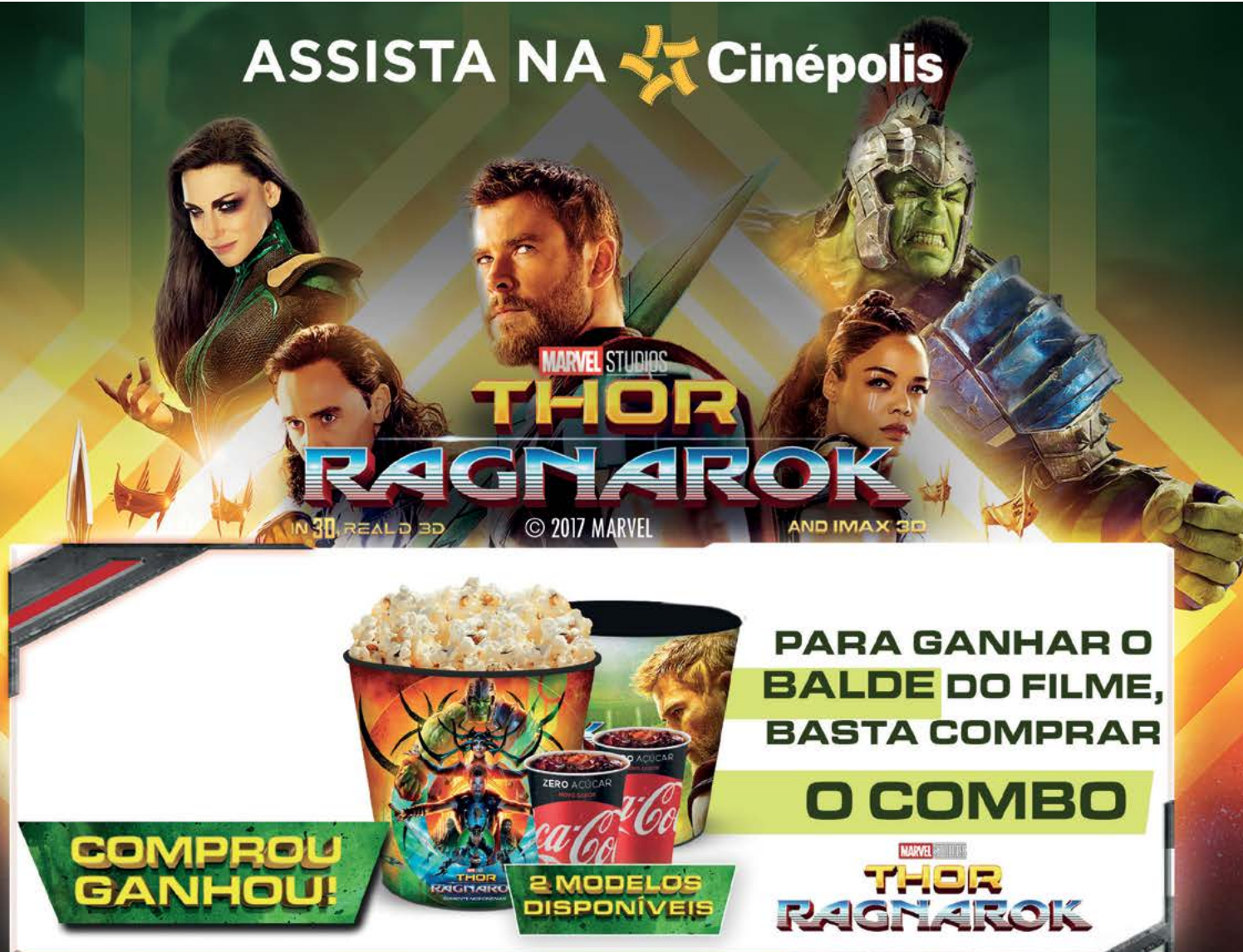
IMAGEM MERAMENTE ILUSTRATIVA. REGRAS SUJEITAS A ALTERAÇÃO SEM AVISO PRÉVIO A ÚNICO E EXCLUSIVO CRITÉRIO DA CINEPOLIS BRASIL. PROMOÇÃO VÁLIDA ENQUANTO DURAREM OS ESTOQUES. COMBO COMPOSTO POR: 1 BALDE DE 2,5 LITROS + 3 BEBIDAS 500ML. OFERTA NÃO CUMULATIVA COM OUTROS BENEFÍCIOS E PROMOÇÕES.

ASSISTA NA SALA: MACRO XE EXTREME DIGITAL EXPERIENCE