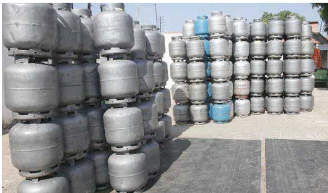
Arquivo / Agência Brasil

Segundo o IBGE, a influência da habitação na medição geral ficou abaixo dos transportes (impacto de 0,11 ponto percentual), afetado também pelos reajustes nos combustíveis. A gasolina teve alta de 1,45% entre setembro e outubro, mesmo com a leve desaceleração em relação período anterior, quando a taxa foi de 3,76%. Pesou ainda o aumento de 7,35% nas passagens aéreas.