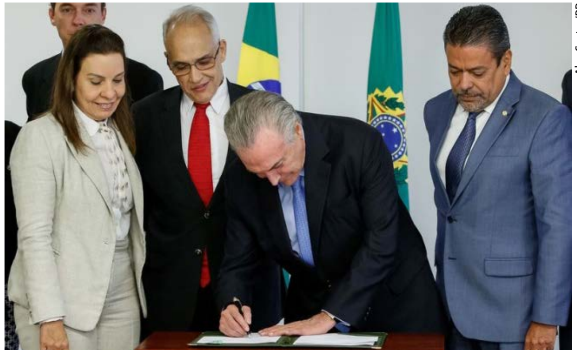
Presidente Michel Temer assinou ontem decreto de transplante e doação de órgãos

A lei cria a Central Nacional de Transplantes (CNT). Ela vai administrar as informações sobre a redistribuição de órgãos doados a pacientes da lista de espera, caso o paciente anteriormente selecionado não