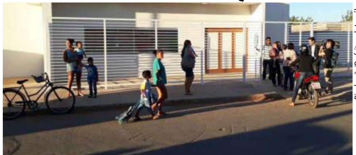
Alunos da creche incendiada agora estudam provisoriamente no prédio da Unidade de Atendimento Infantojuvenil de Janaúba

A reconstrução da creche Gente Inocente será financiada por um grupo de empresários de Janaúba e Montes Claros e a previsão de retomada das aulas no local é no início de 2018.